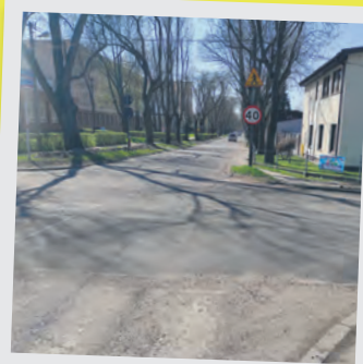
Skrzyżowanie ul. Franciszkańskiej i Okopowej