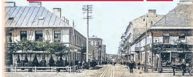
Cukiernia Konrada w Rynku Nowego Miasta