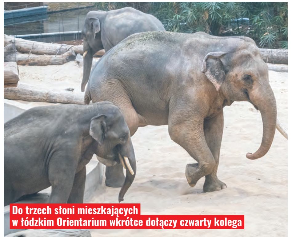
Do trzech słońi mieszkających w łódzkim Orientarium wkrótce dołączy czwarty kolega