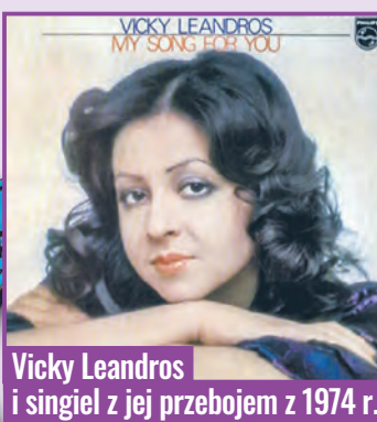
Vicky Laeandros i singiel z jej przebojem z 1974 r.

tam znany do dziś. Wśród łodzian nie jest to popularny utwór, a to przecież piosenka z duszą miasta i akcentami historycznymi, nawiązującymi do wielokulturowej Łodzi – tekst wywodzi się z czasów dynamicznego rozwoju Łodzi przemysłowej z przełomu XIX i XX w. Pierwszą wersję piosenki stworzyli Żydzi z podłódzkich wsi, wychwa-