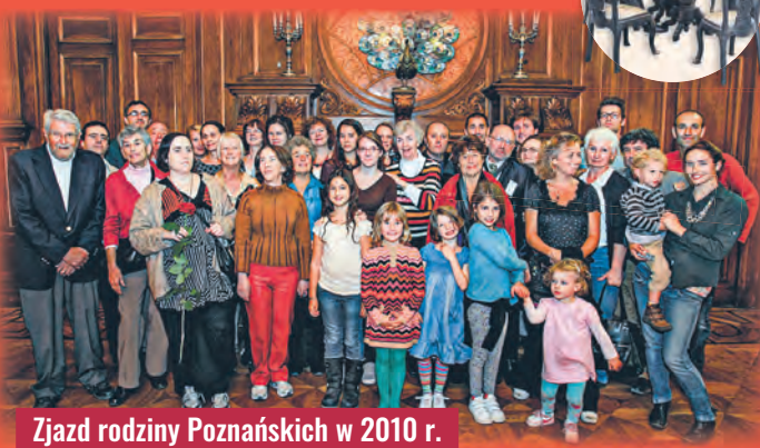
Zjazd rodziny Poznańskich w 2010 r.

plastę rodu, a inni nie wiedzieli w ogóle, że ich przodek mieszkał w „łódzkim Luwrze”. agr