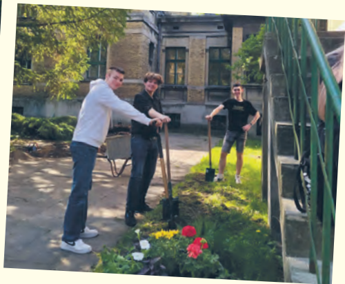
Młodzież z Centrum Kształcenia Zawodowego sama zabrała się za przygotowanie swojej strefy relaksu