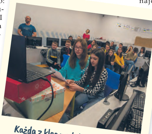
Każda z klas ma jak najciekawiej zaprezentować swój projekt

Pilotażowy program szkolnego budżetu obywatelskiego obejmuje 16 szkół: osiem ponadpodstawowych i osiem podstawowych. Każda z nich ma szansę na zdobycie 4 tys. zł na reali-