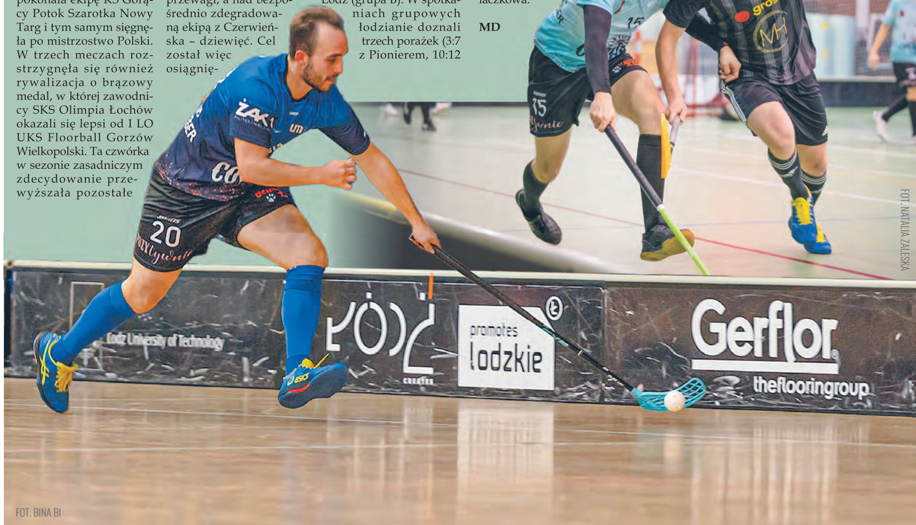
FOT. NATALIA ZALESKA