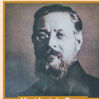
Albert Arystydes Thomas

To niezwykle barwna i znana postać na międzynarodowej arenie politycznej. Thomas był rzecznikiem niepodległości i suwerenności Polski, którą popierał na konferencji w Wersalu. W latach 1920–1932 zasłynął jako dyrektor Międzynarodowej Organizacji Pracy przy Lidze Narodów w Genewie. 24 lutego 1924 r. ten „bojownik o wszechludzkie ideały i wypróbowany