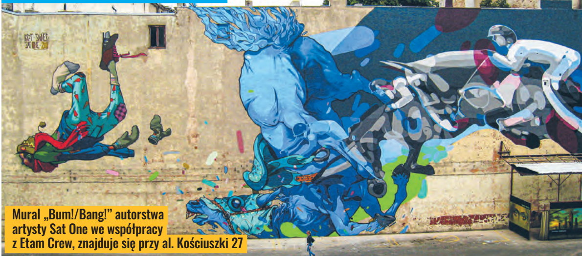
Mural „Bum!/Bang!” autorstwa artysty Sat One we współpracy z Etam Crew, znajduje się przy al. Kościuszki 27

Kolejne wydanie 20 czerwca w poniedziałek