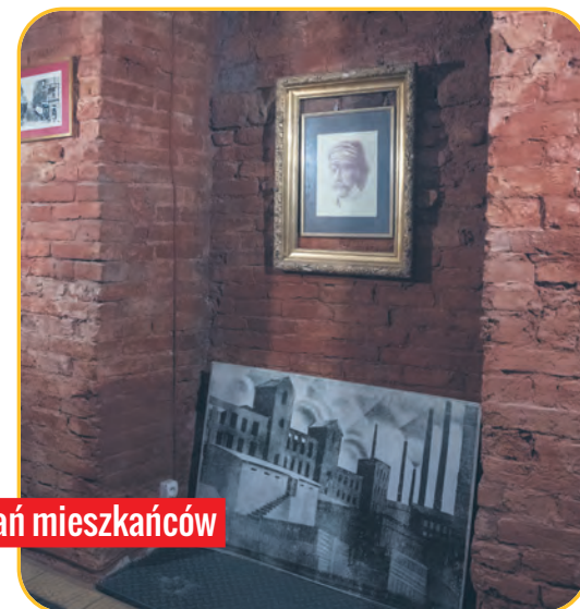
Ignorantka to nie tylko bar, a przede wszystkim miejsce spotkań mieszkańców