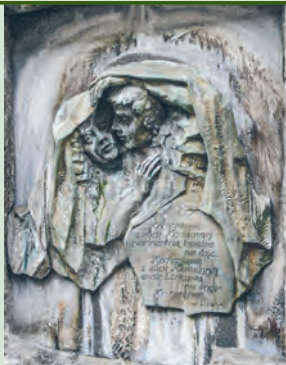
Płaskorzeźba, obecnie zdjęta, po remoncie kamienicy wróci na ul. Włókienniczą (dawniej Kamienną)

25 czerwca 2004 r. odsłonięto we wnęce na ścianie kamienicy przy ul. Włókienniczej (dawniej ul. Kamienna) oryginalną płaskorzeźbę i fontannę opatrzoną napisem: Kochankowie z ulicy Kamiennej. Została ona dedykowana Agnieszce Osieckiej (1936-1997) dla upamiętnienia okresów jej studiów w Łódzkiej Szkole Filmowej w latach 1957-1962. W czasie studiów na wydziale reżyserii zrealizowała etiudę „Słoń”, opartą na motywach opowiadania Sławomira Mrożka i odbyła praktykę na planie „Niewinnych czarodziejów” Andrzeja Wajdy. Nie była jej chyba jednak pisana kariera filmowca i wspomniała tak: „Na drugim czy trzecim roku