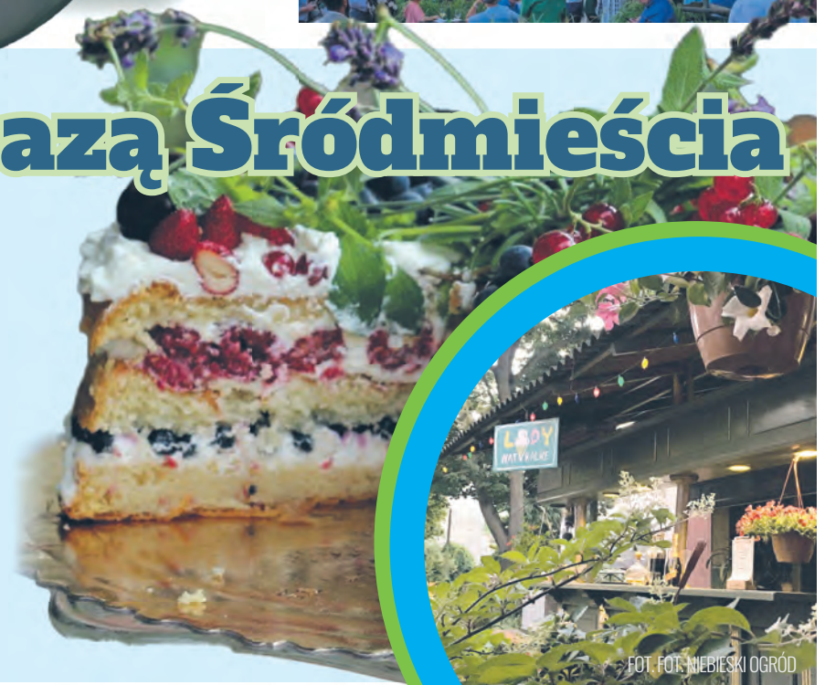
FOT. FOT. NIEBIESKI OGRÓD