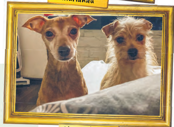
Okruszek i Tofik