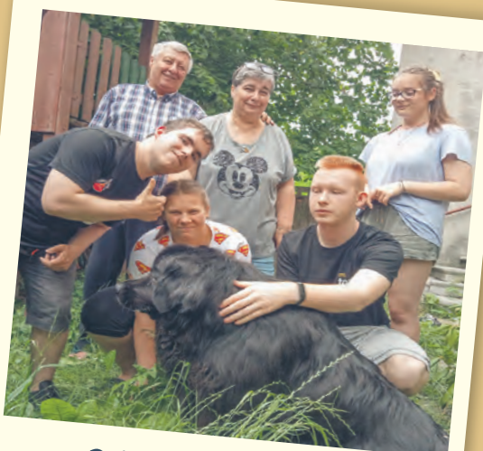
Rodzina jest najważniejsza