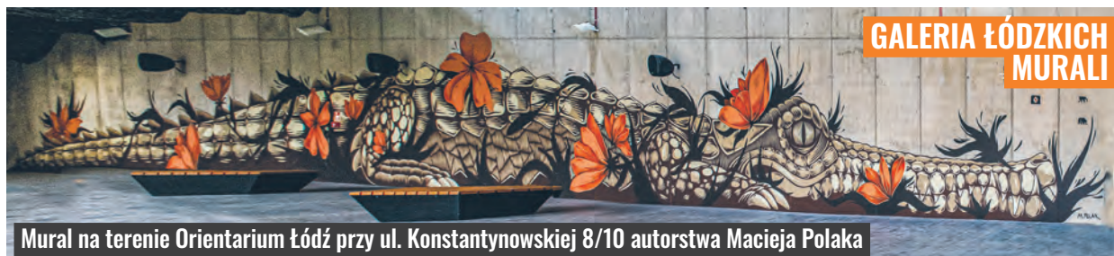
GALERIA ŁÓDZKICH MURALI

Mural na terenie Orientarium Łódź przy ul. Konstantynowskiej 8/10 autorstwa Macieja Polaka