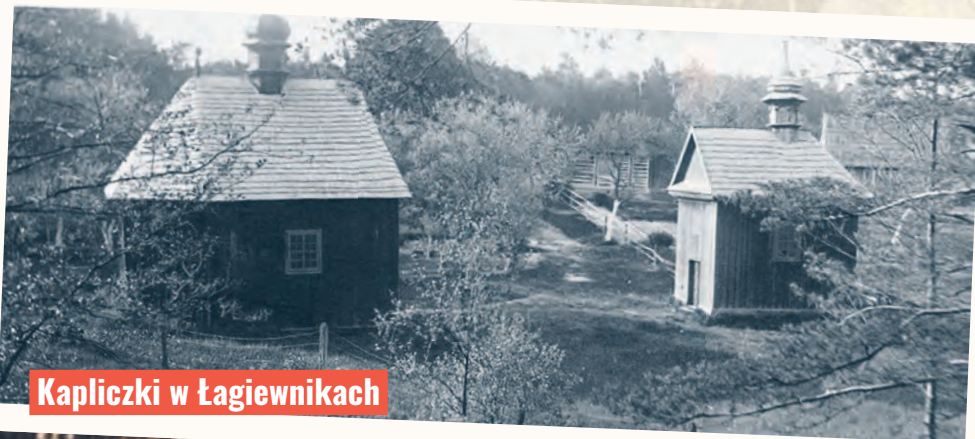
Kapliczki w Łagiewnikach

porządku dziennym były połamane gałęzie i rozrzucone śmieci. W prześmiewczym wierszyku pisano nawet tak: „Smukłe flaszki po wódce i pękate po winie / Kuszą szklanym uśmiechem w zaśmiecanej gęstwinie”. Niestety ten niezbyt chlubny zwyczaj