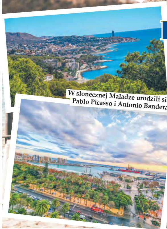
W słonecznej Maladze urodzili się: Pablo Picasso i Antonio Banderas

Zimowy rozkład lotów wejdzie w życie 27 października 2023 r.