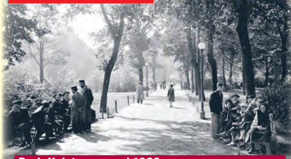
Park Kolejowy przed 1939 r.

ŁÓDŹ.pl DLA SENIORA | DLA RODZIN | DLA KOCHAJĄCYCH ŁÓDŹ