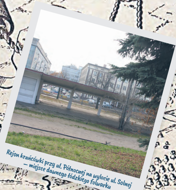
Rejon krańcówki przy ul. Północnej na wylocie ul. Solnej – miejsce dawnego łódzkiego folwarku