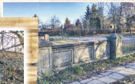
Most na ul. Źródłowej (rzeka Łódka)

Łódź była miastem nie tylko fabrycznych kominów, ale też mostów, mostków i kładek. Liczne ciekie wodne, otwarte rowy i rynsztoki odprowadzające ścieki i deszczówkę wymagały budowy licznych przepraw. Mało kto obecnie zdaje sobie sprawę z tego, jak wiele było mostków w ścisłym centrum Łodzi.