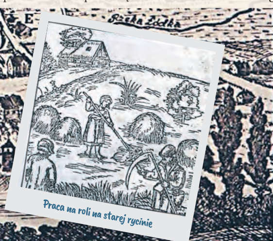
Praca na roli na starej rycinie