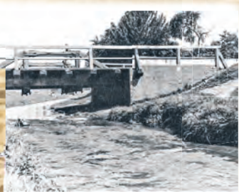
Most na ul. Odolanowskiej (rzeka Łódka)