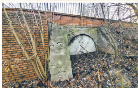
Zamurowany przepust pod ul. Przędzalnią. Tu płynęła rzeka Jasień