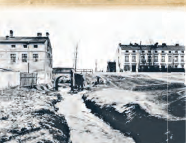
Rzeka Łódka w 1933 r. Most na ul. Srebrzyńskiej