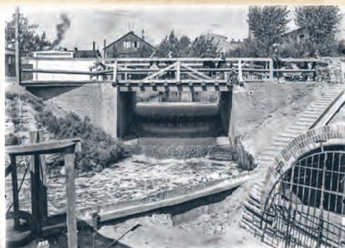
Drewniany most na Jasieniu przy ul. Pięknej