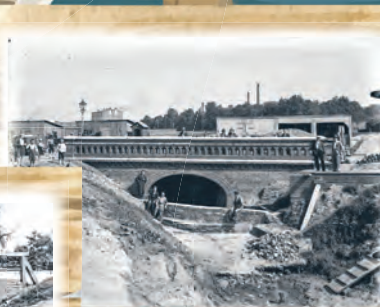
Most przy ul. Wólczańskiej (rzeka Dąbrówka)