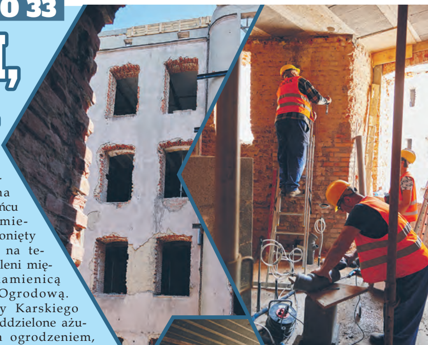
Mieszkania zostaną urządzone pod klucz, co oznacza, że nowi lokatorzy będą mogli od razu się wprowadzić

Remont kamienicy potrwa jeszcze około rok. Wykonawca ma przed sobą prace na zabytkowej elewacji, montaż nowych okien, drzwi i ścianek działowych, wykonanie tynków oraz posadzek, rozprowadzenie instalacji po lokalach, urządzenie podwórka i wreszcie, wyposażenie mieszkań w sprzęt. Aha