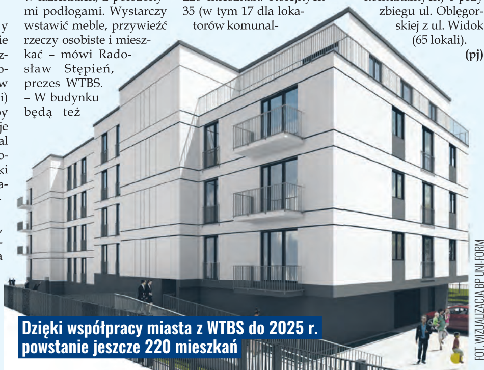
Dzięki współpracy miasta z WTBS do 2025 r. powstanie jeszcze 220 mieszkań