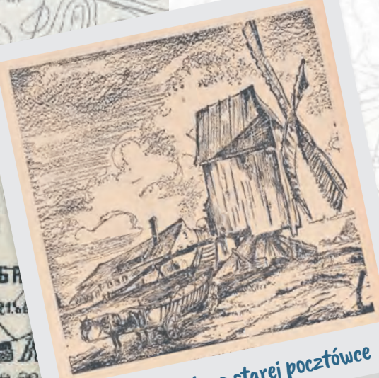
Łódzki wiatrak na starej pocztówce