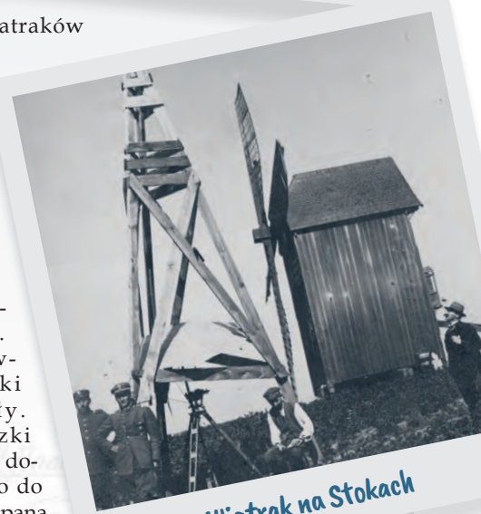
Wiatrak na Stokach