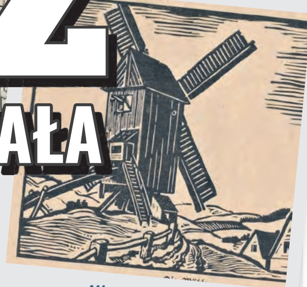
Młyn na wzgórzu