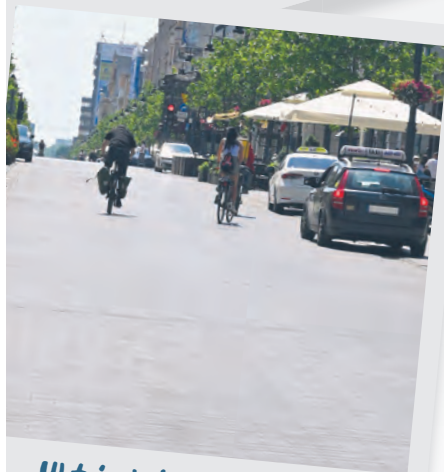
W tej okolicy stały młyny. Skrzyżowanie Piotrkowska/Struga