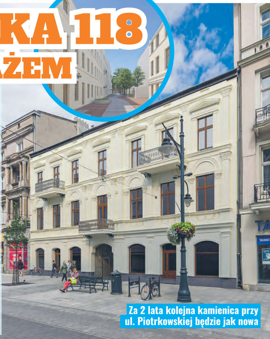
Za 2 lata kolejna kamienica przy ul. Piotrkowskiej będzie jak nowa