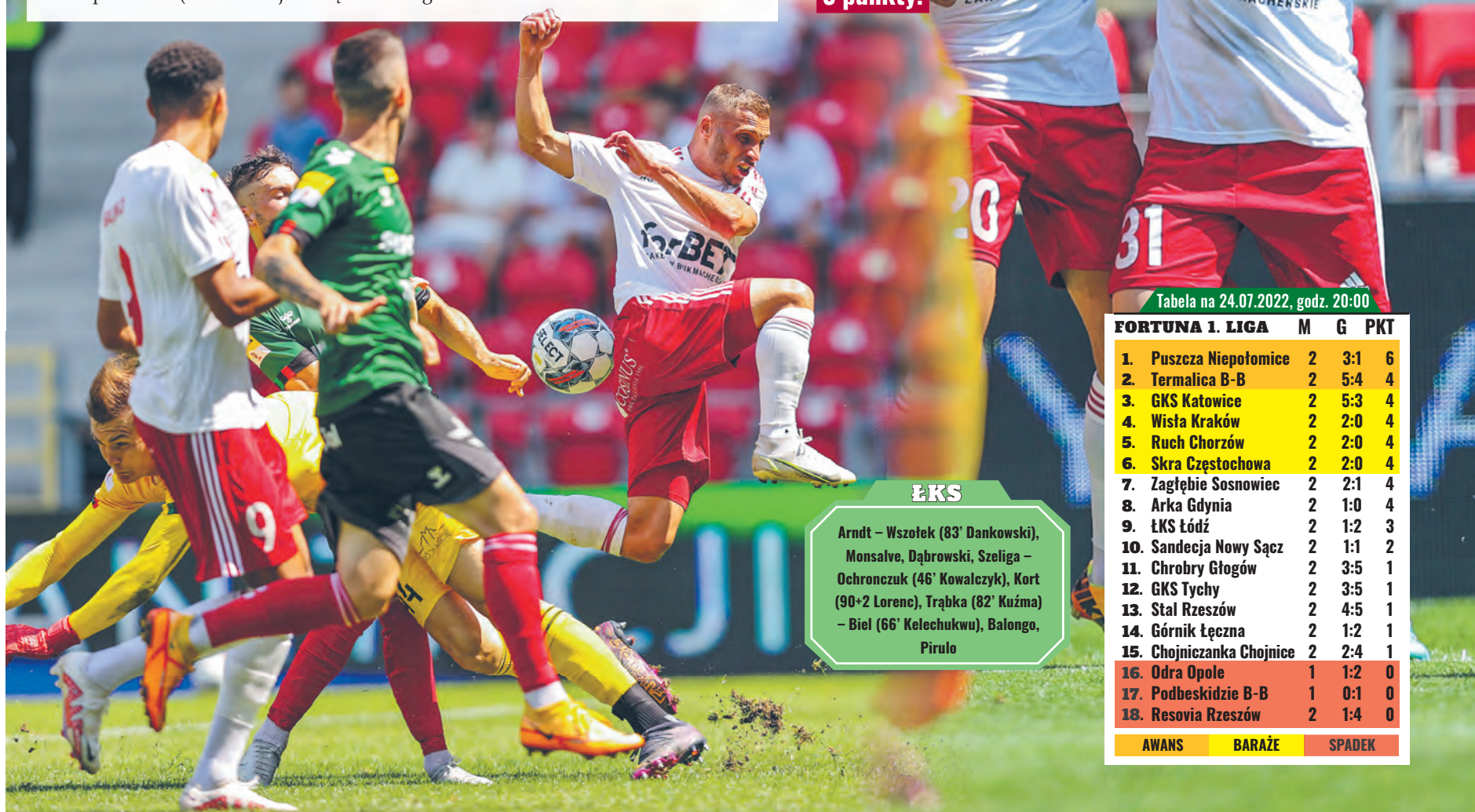
Tabela na 24.07.2022, godz. 20:00