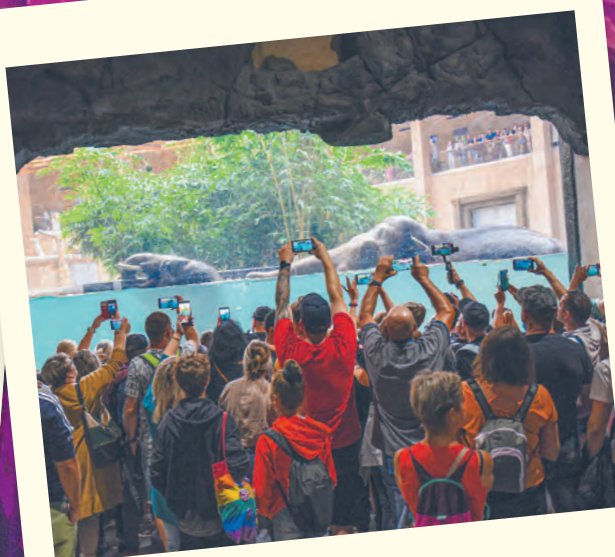
Tłumy w Orientarium