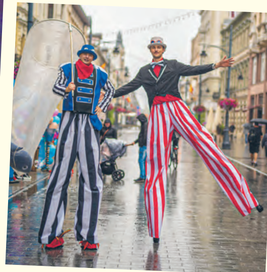
Szczudlarze na Piotrkowskiej