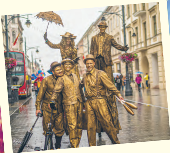
Mimowie na Piotrkowskiej