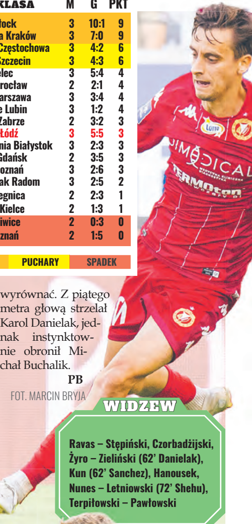
Tabela na 1.08.2022