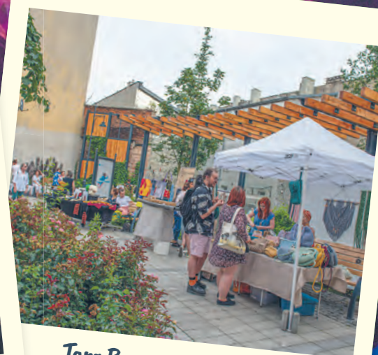
Targ Rzeczy Wszelakich w Pasażu Róży