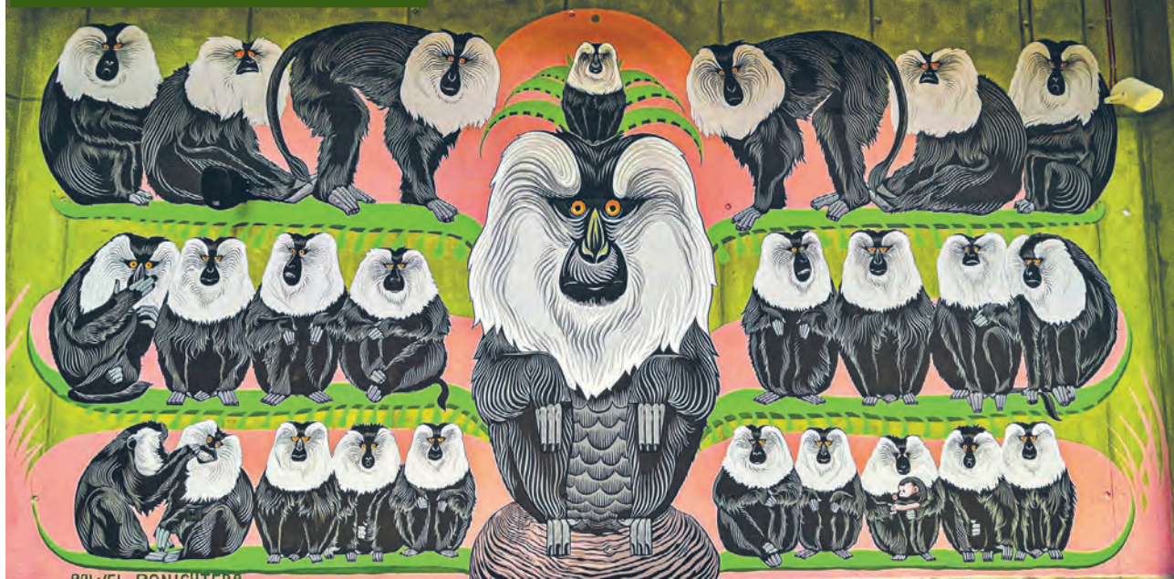
Mural w Orientarium Łódź przy ul. Konstytucyjnej 8/10, autorstwa Pawła Ponichtery