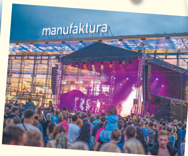
Koncerty w Manufakturze