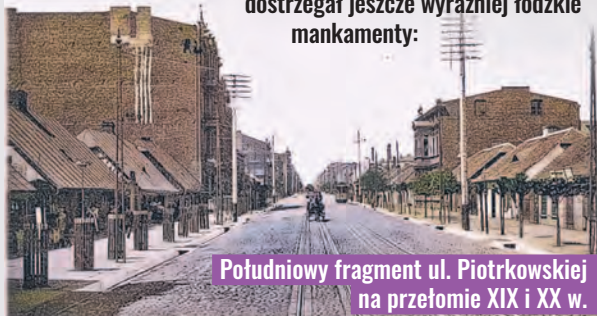
Południowy fragment ul. Piotrkowskiej na przełomie XIX i XX w.