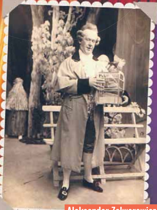
Aleksander Zelwerowicz w jednej ze swoich sztandarowych fredrowskich ról – pana Jowialskiego