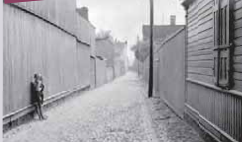
Enklawy biedy w dawnej Łodzi pośród osiedli fabrycznych

„Pisać o nędzy proletariatu łódzkiego, o wyżółkłych ojcach, wychudłych matkach, gruźliczych dzieciach, szczurzych podwórzach, cuchnących rynsztokach, ciemnych norach zwanych jeszcze »mieszkaniem« (przyszłość je dopiero po imieniu nazwie: to są groby, za które ci nędzarze płacić muszą za życia komorne), pisać o potwornych warunkach »higienicznych«, na które skazana jest ludność największego po Warszawie miasta wolnej, niepodleg-