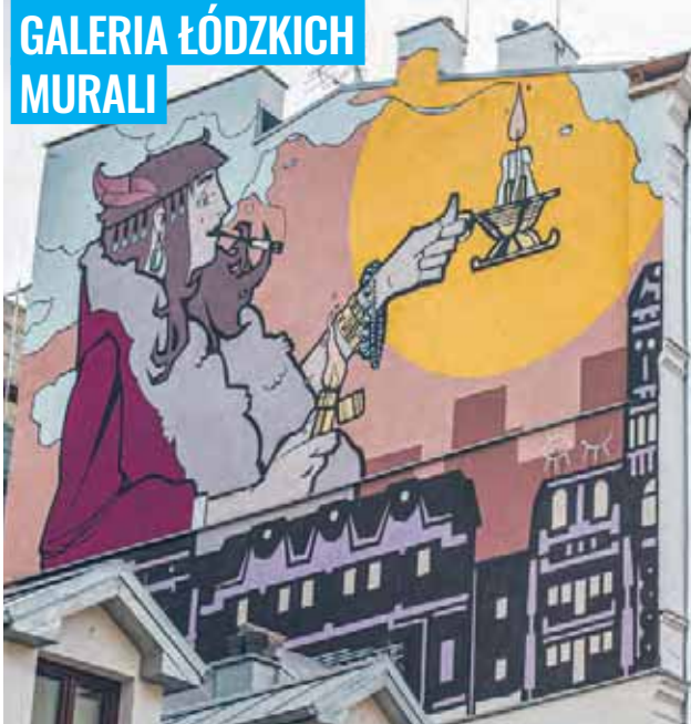
Mural poświęcony Ślepemu Maksowi na kamienicy przy ul. Pomorskiej 11 autorstwa łódzkiego artysty Martyna Gilla