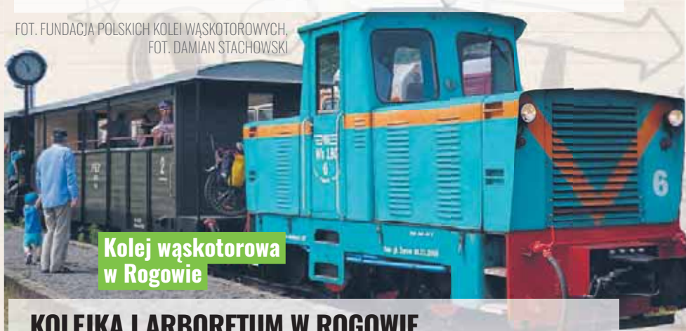
Kolej wąskotorowa w Rogowie