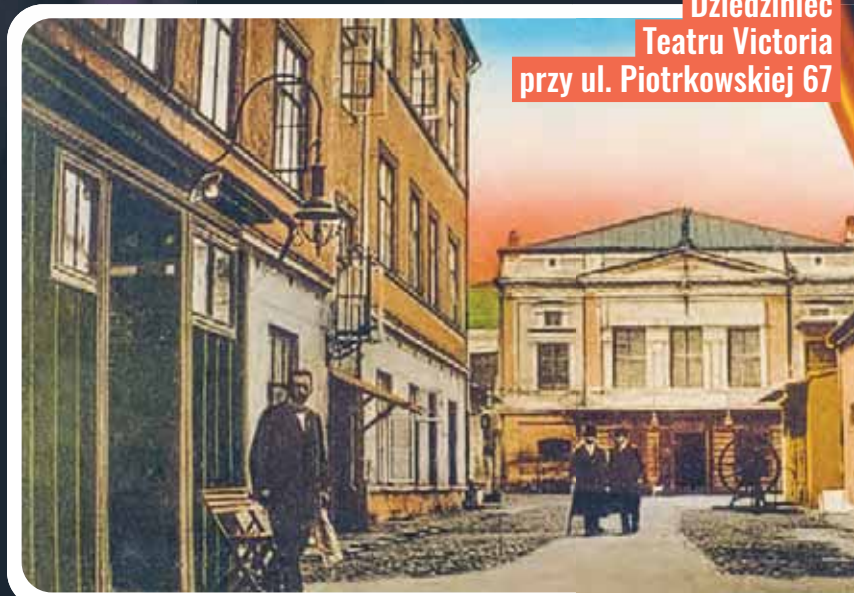
Dziedziniec Teatru Victoria przy ul. Piotrkowskiej 67