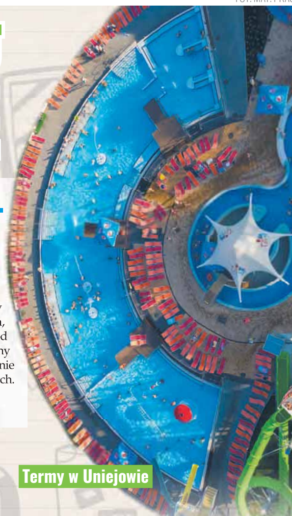
Termy w Uniejowie

Interesującą ofertę na rodzinną wycieczkę znajdziemy także w bliskim sąsiedztwie Uniejowa. W Borysewie czeka na nas ZOO Safari, które słynie z białych lwów i tygrysów bengalskich, a w Poddębicach – Ogród Zmysłów, zaprojektowany tak, by poznając otoczenie skupić się na jednym z nich.