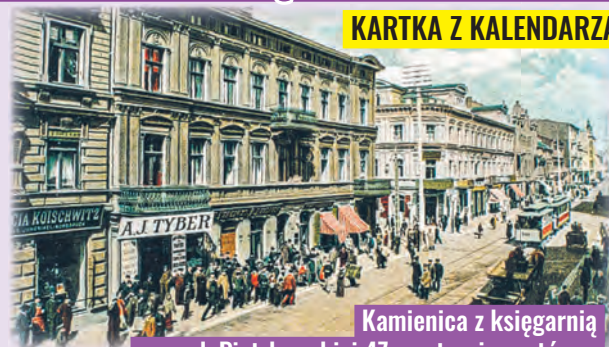
KARTKA Z KALENDARZA