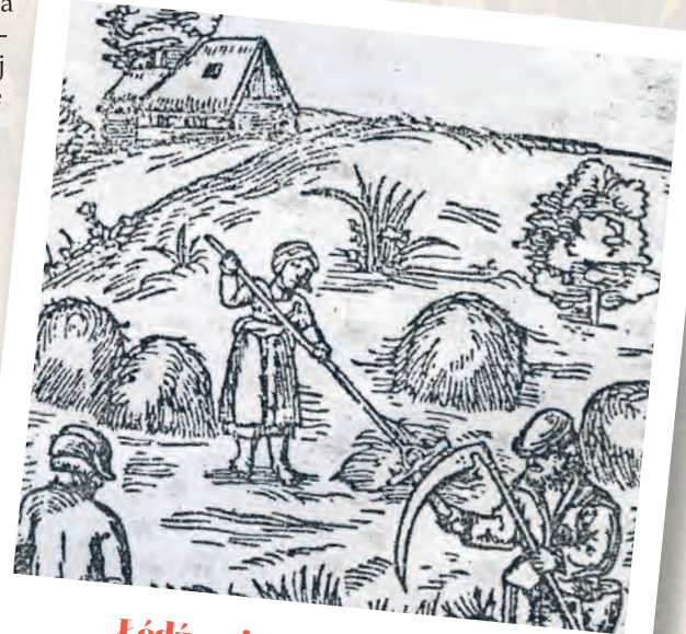
Łódź - miasto przemysłowe - ma korzenie rolnicze

a także pięć młynów i dwie osady przemysłowe, które odegrały istotną rolę w późniejszym rozwoju miasta. Natomiast kolebkę miasta Łodzi stanowi rejon Starego Ryn-