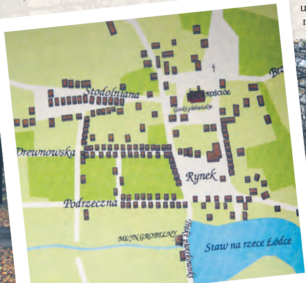
Układ i zabudowa rolniczej Łodzi