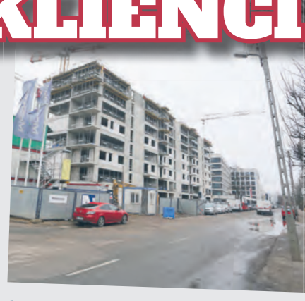
Inwestycja Vantage Development w budowie