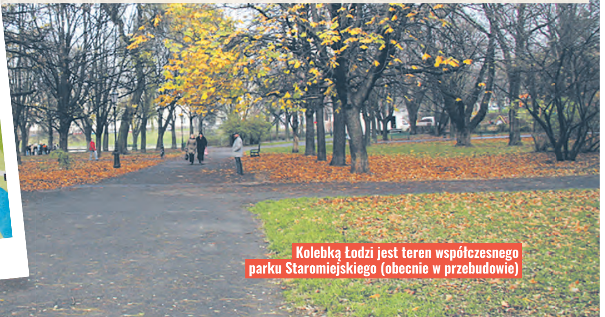
Kolebką Łodzi jest teren współczesnego parku Staromiejskiego (obecnie w przebudowie)