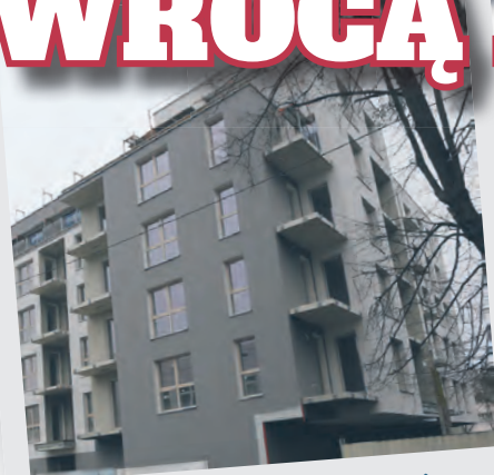
Rembielińskiego 33/35 – realizacja