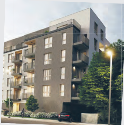
Rembielińskiego 33/35 – wizualizacja