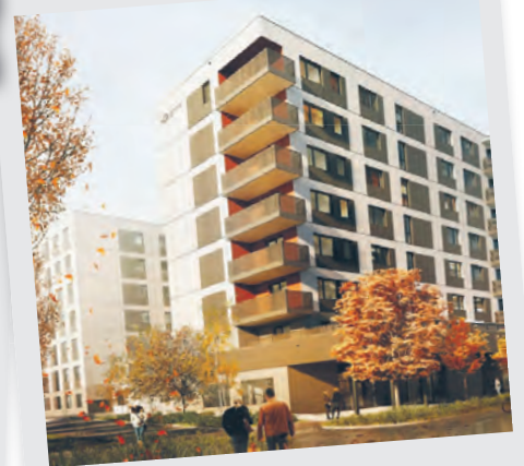
Tak ma wyglądać gotowy dom

Niespełna 500-metrowa ul. Rembielińskiego, jeszcze do niedawna o dość sennym charakterze, czeka w niedalekiej perspektywie spore ożywienie. Do ponownego otwarcia szykuje się centrum Sukcesja, a w pobliżu pojawiają się nowe domy, które wkrótce zapełnią się lokatorami.