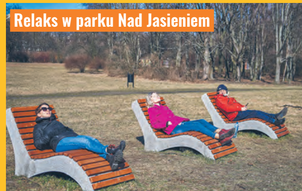
Relaks w parku Nad Jasioniem

– W okresie od 9 stycznia do 5 lutego średnia maksymalna temperatura po-