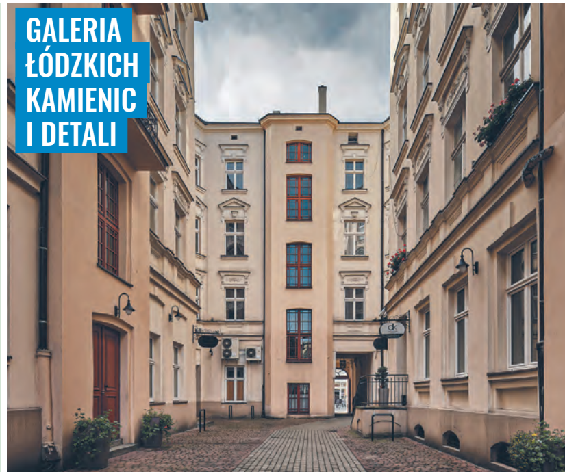
Podwórko kamienicy Janusza Warszawskiego wzniesionej przy ul. Piotrkowskiej 114 w 1893 r. wg projektu Ignacego Markiewicza w stylu barokowo-empirycznym