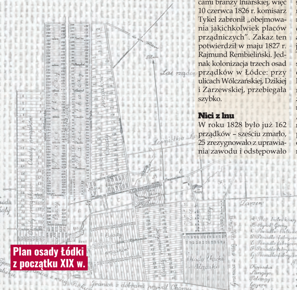
Plan osady Łódki z początku XIX w.

42 działki budowlane po 3 morgi każda. Piętnaście działek było równoległych do ul. Przędzalnianej, zaś 27 znajdowało się już na północ od ul. Budowlanej (jak wtedy nazywano dalszy ciąg ul. Przybyszewskiego). Tak powstała ostatnia w tym czasie osada przemysłowej Łodzi, do której Tytus Kopisch sprowadził tkaczy lnianych ze Śląska w celu osiedlenia się. Oni to nazwali swoją osadę Schlesingiem, czyli Ślązakami. Świetnie rozwijającą się karierę przemysłowej Łodzi zahamowały na pewien czas powstanie listopadowe, wprowadzenie drakońskich przepisów celnych oraz polityka dyskryminacyjna władz carskich wobec przemysłu Królestwa Polskiego. agr