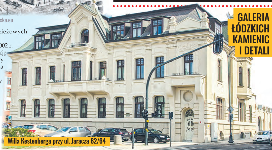
Willa Kestenberg przy ul. Jaracza 62/64