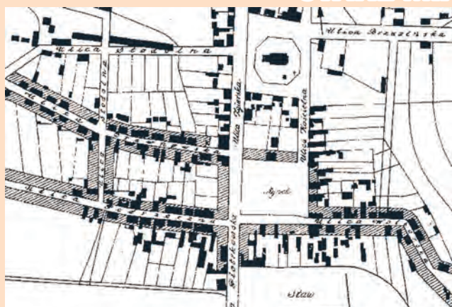
Plan Łodzi z 1853 r. z widocznym Starym Rynkiem i ówczesnymi zabudowaniami

Ważnym okresem w rozwoju Łodzi i najbliższych okolic były lata 60. XIX w., co wiązało się m.in. z utworzeniem pierwszych przedmieść, uwłaszczeniem chłopów w 1864 r. oraz budową kolei fabryczno-łódzkiej. Głód terenów budowlanych przy-