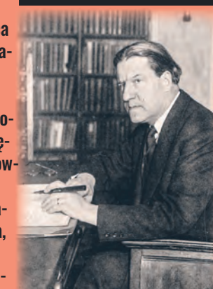
Rabin Stephen Wise, prezes Amerykańskiego Kongresu Żydowskiego w czasie wojny