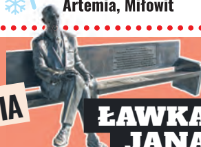
ŁAWKA JANA KARSKIEGO

Alarm o totalnej eksterminacji adresowany był do Departamentu Stanu USA, ale wtedy Sumner Welles, pierwszoplanowa postać amerykańskiej polityki, natychmiast zabronił rozpowszechniania tych wiadomości. Argument był jeden – Stany Zjednoczone muszą możliwie szybko i przy małych stratach wygrać wojnę. Wszystko, co mogłoby zakłócić ten cel, musi być odrzucone. Problem zagłady ludności żydowskiej był bardzo trudny, bo nie było właściwie żadnej koncepcji jej uratowania. Karskiemu pozostała zatem ostatnia nadzieja, czyli audiencja u Franklina Roosevelta wyznaczona na 28 lipca 1943 r. agr