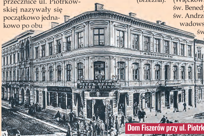
Dom Fiszerów przy ul. Piotrkowskiej 54 na rogu ul. Dzielnej. Widok z końca XIX w.

W 1887 r. wykonano nowe, ale już z dwujęzycznymi nazwami ulic. Również były one ocynkowane, polakierowane na kolor ciemnoniebieski, z dużymi, białymi napisami i czerwonym otokiem, czyli w podobnych barwach, do których nawiązują obecne oznaczenia łódzkich ulic. agr