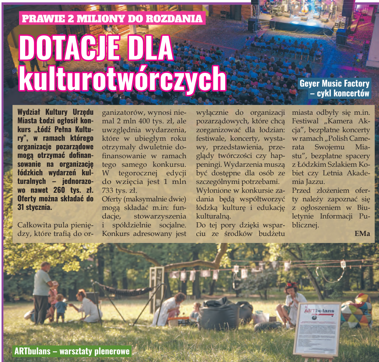
ARTbulans – warsztaty plenerowe