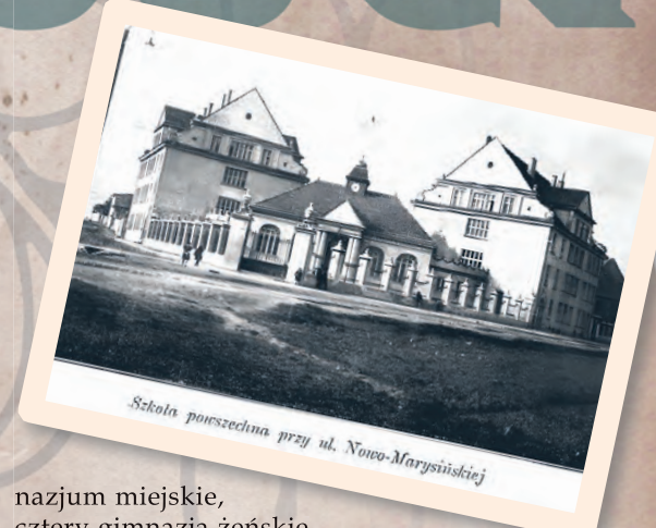
Szkola powszechna przy ul. Nowo-Marysińskiej

Dziesiątki lat zaniedbań oświatowych wymagały czasu oraz stworzenia na potrzeby miasta całego systemu oświaty – od szkół powszechnych po kolejne etapy kształcenia. Mimo znaczącej ofensywy budowlanej na rzecz edukacji, to np. w 1937 r. ponad 70 szkół nadal znajdowało się w wynajętych pomieszczeniach, a tylko 39 miało samodzielne budynki. Średnio na jedną salę lekcyjną przypadало 61 uczniów, co zmuszało do lekcji nawet na trzy zmiany. Działały też szkoły mniejszości narodowych, co wynikało ze struktury populacji Łodzi – Żydzi dysponowali dziewięcioma szkołami średnimi, jedną szkołą zawodową i 31 szkołami powszechnymi. Niemcy posiadali 30 szkół powszechnych z wykładem niemieckim, gim-