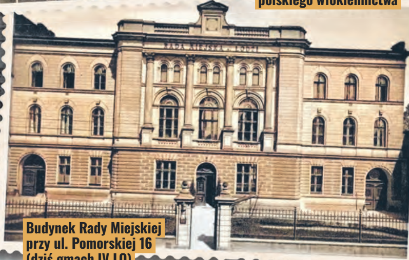
Budynek Rady Miejskiej przy ul. Pomorskiej 16 (dziś gmach IV LO)