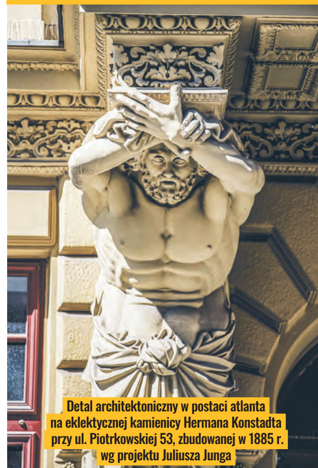
Detal architektoniczny w postaci atlanta na eklektycznej kamienicy Hermana Konstadta przy ul. Piotrkowskiej 53, zbudowanej w 1885 r. wg projektu Juliusza Junga