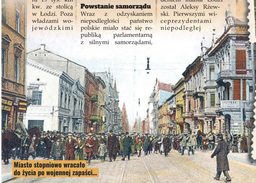
Miasto stopniowo wracało do życia po wojennej zapaści...