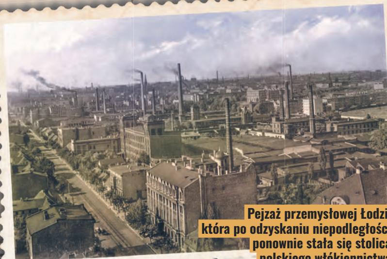
Pejzaż przemysłowej Łodzi, która po odzyskaniu niepodległości ponownie stała się stolicą polskiego włókiennictwa