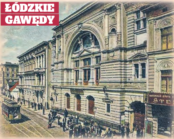
Dom koncertowy Vogla przy ul. Dzielnej 18 na pocz. XX w.

wych. Imprezy te oddawały witalność rozwijającego się miasta. „Wstęp otwarty jest dla wszystkich bez różnic stanu, narodowości i stroju. W jednej z łóż gra hałaśliwa orkiestra. W sąsiedniej salce płyną strumienie wódki i piwa, w łóżach piętrowych gruchają zakochane pary. Na dole, w olbrzymiej sali wre ochoczy taniec, orkiestra różnie marsza, huczą okrzyki, grzmi tupanie, kilkadziesiąt par odważnych bez ładu i porządku sunie po olbrzymiej hali, szezleszczą suknie, zmęczone piersi tancerek falują, twarze płoną, oczy błyszczą” – tak opisywał łódzki