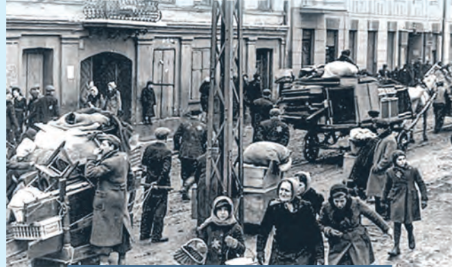
Przesiedlanie do łódzkiego getta zimą 1940 r.