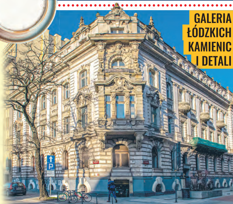
Eklektyczna kamienica Karola Kretschmera przy ul. 6 Sierpnia 5 z 1896 r.