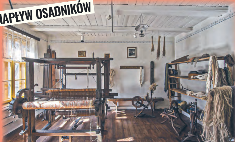
Pierwsi łódzcy tkacze zakładali warsztaty produkcyjne w swoich domach