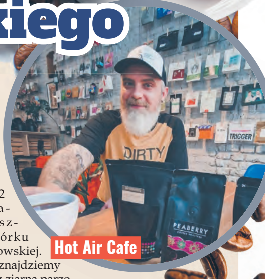
Hot Air Cafe