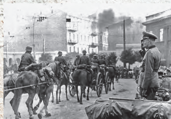
Defilada wojsk Wehrmachtu na pl. Wolności 8 września 1939 r.