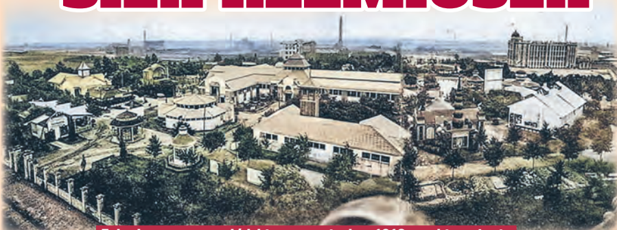
Zabudowa wystawy łódzkiego rzemiosła z 1912 r. robi wrażenie

Koniec XIX w. był w dziejach Łodzi okresem intensywnej rozbudowy przemysłu. Fabryki, których wciąż przybywało, górowały nad drobną produkcją. W 1898 r. wartość produkcji łódzkiej branży włókienniczej wyniosła ponad 100 mln rubli, co stanowiło 1/4 wartości całego przemysłu Królestwa Polskiego. Ważną funkcję w rozwoju miasta na przełomie XIX i XX w. spełniały również łódzkie firmy handlowe, a także rzemieślnicy. Stowarzyszenia cechowe i społeczne dążyły do ogra-