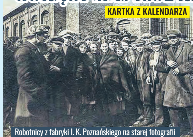
Robotnicy z fabryki I. K. Poznańskiego na starej fotografii

8 maja 1892 r. zakończył się robotniczy protest nazwany buntom łódzkim. Ferment wywołały pierwszomajowe odezwy Związku