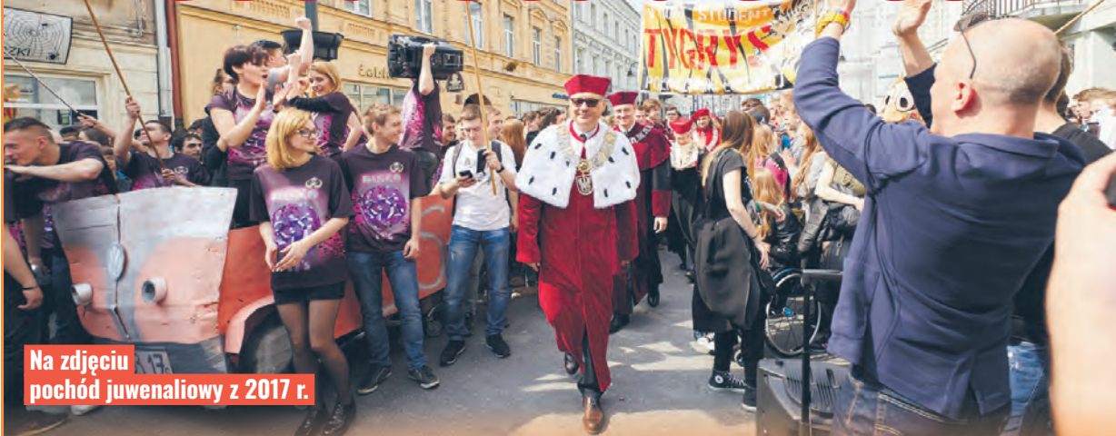
Na zdjęciu pochód juwenaliowy z 2017 r.

W poniedziałek (6 maja) rozpoczęły się juwenalia studentów Uniwersytetu Łódzkiego i Uniwersytetu Medycznego w Łodzi. Potrwać one do 14 maja.