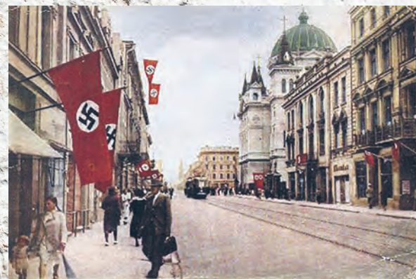
Na łódzkich ulicach pojawiły się faszystowskie flagi, tabliczki z niemieckimi nazwami. Ul. Piotrkowska została przemianowana na Adolf Hitler Strasse, a al. Kościuszki na Hermann Göring Strasse