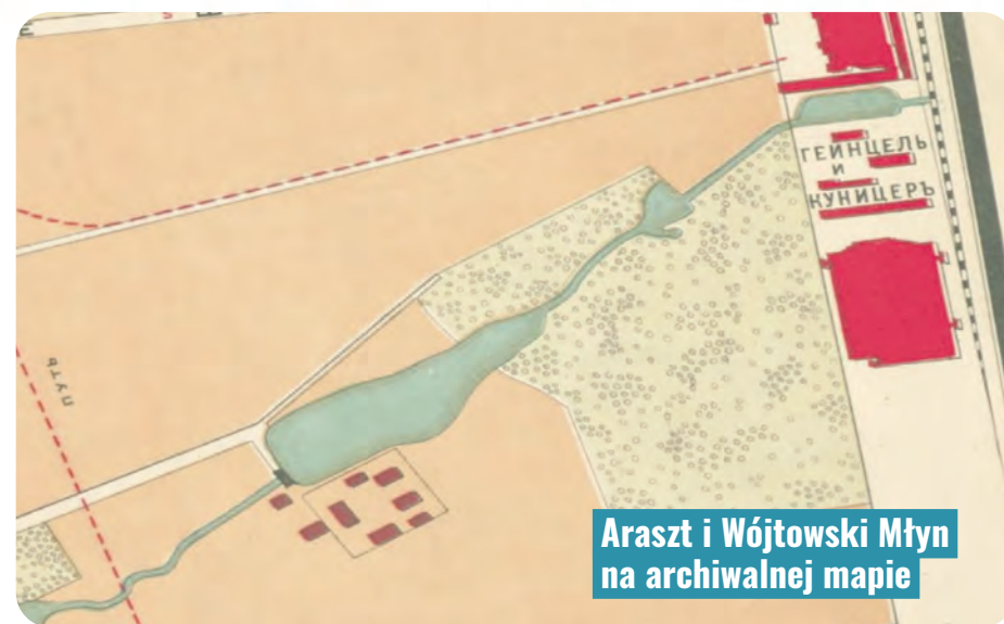
Arasz i Wójtkowski Młyn na archiwalnej mapie

W przyszłości park nad Jasieniem przejdzie metamorfozę. Staw będzie peł-