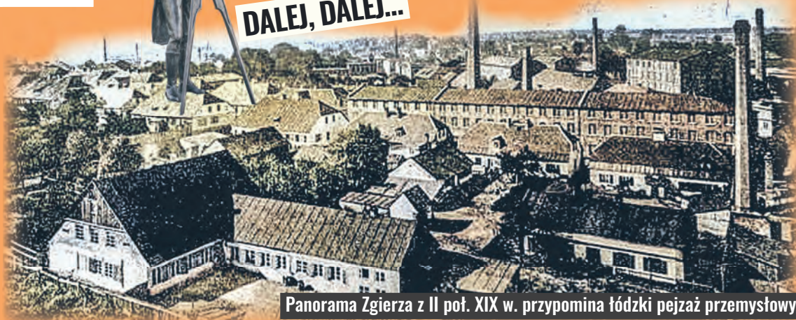
Panorama Zgierza z II poł. XIX w. przypomina łódzki pejzaż przemysłowy

Większość projektów tworzonych w tzw. okresie konstytucyjnym Królestwa Polskiego cechował geometryczny układ. Wpływy te widać wyraźnie w rozplanowaniu innych miast przemysłowych obwodu łęczyckiego: Aleksandrowa, Konstancyńska czy Zgierza, które cechują się prostotą, symetrią i przejrzystą kompozycją.