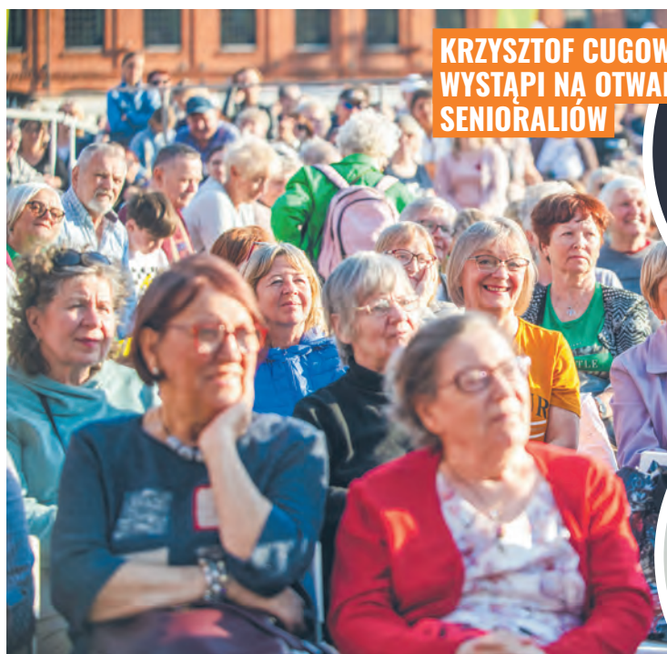
KRYSZTOF CUGOWSKI WYSTĄPI NA OTWARIU SENIORALIÓW