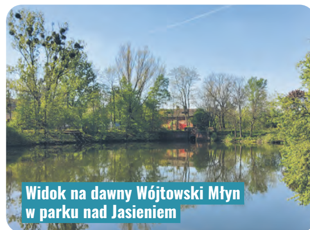
Widok na dawny Wójtkowski Młyn w parku nad Jasieniem

nić funkcje rekreacyjne, a w zabytkowych budynkach stojących w miejscu Wójtkowskiego Młyna powstanie restauracja lub centrum edukacyjne. Park nad Jasieniem zostanie połączony nową ścieżką ze zbiornikiem przy ul. Przędzalnianej. Mieszkańcy będą mogli wypoczywać nad jego brzegiem na nowej plaży.