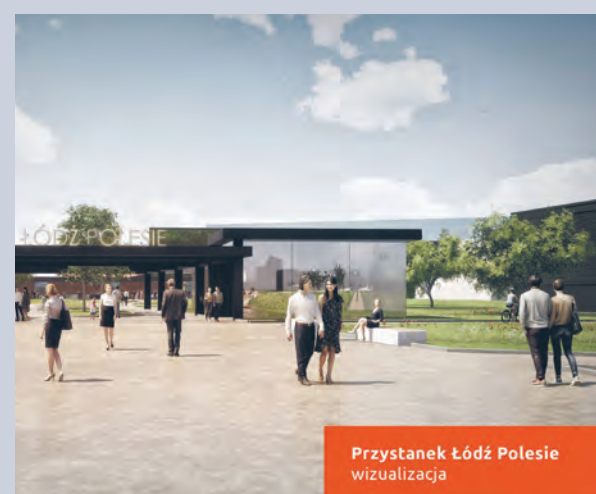
Przystanek Łódź Polesie wizualizacja