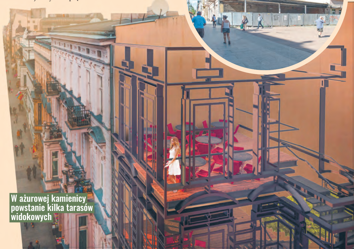
W ażurowej kamienicy powstanie kilka tarasów widokowych