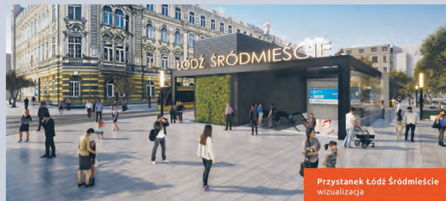
Przystanek Łódź Śródmieście wizualizacja