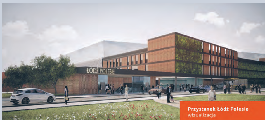
Przystanek Łódź Polesie wizualizacja