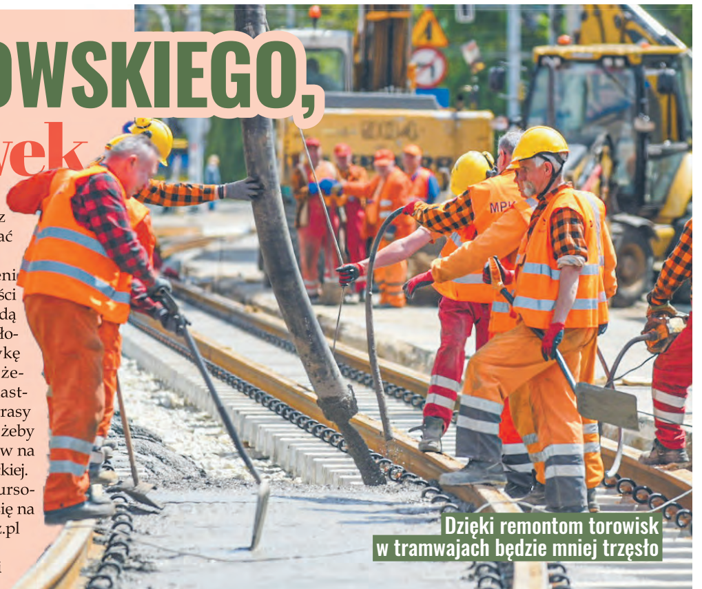
Dzięki remontom torowisk w tramwajach będzie mniej trzęsot