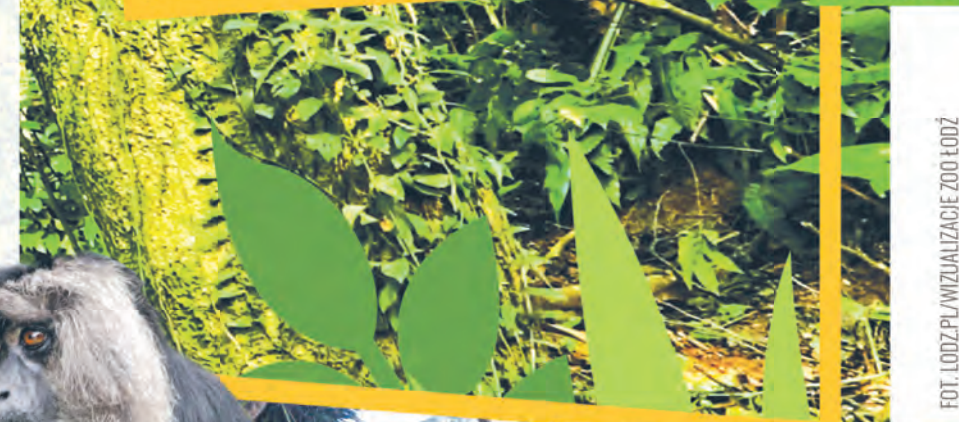
FOT. LODZ.PL/WIZUALIZACJE ZOO ŁÓDŹ