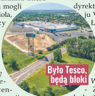
Było Tesco, będą bloki