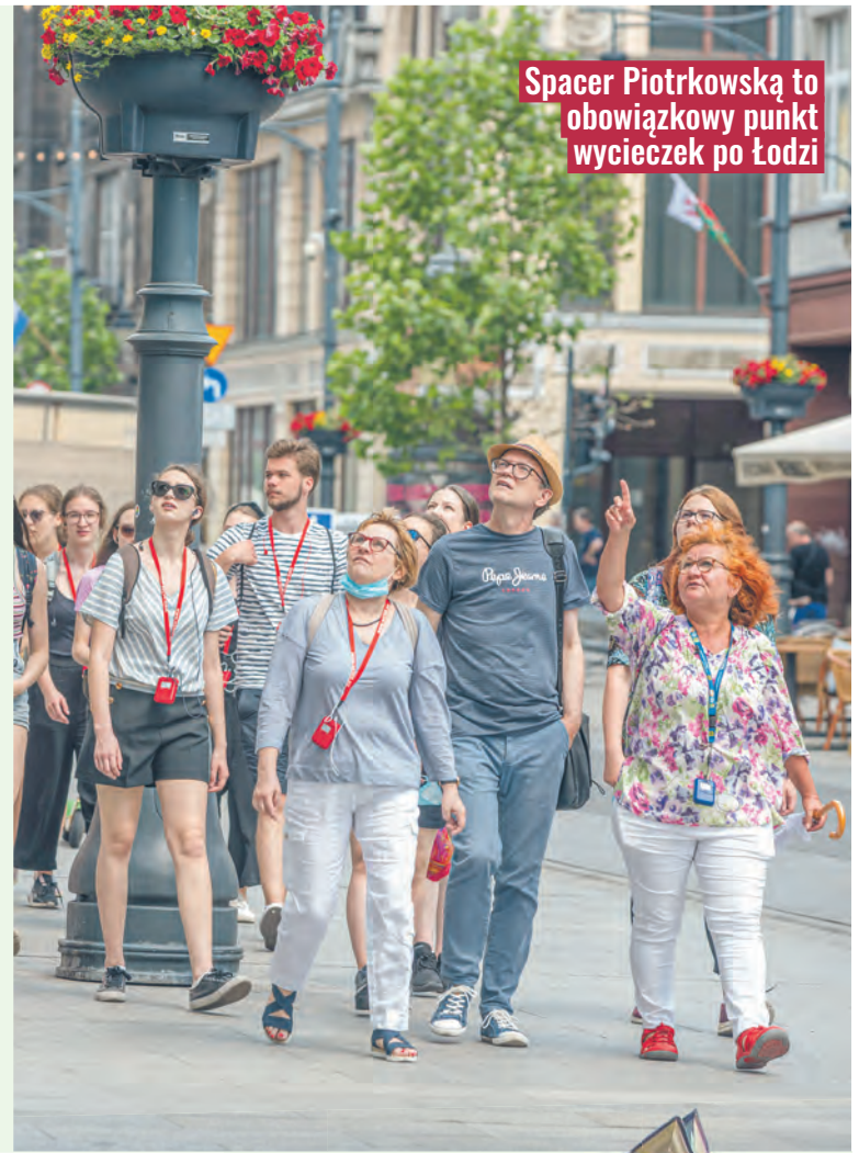
Spacer Piotrkowską to obowiązkowy punkt wycieczek po Łodzi