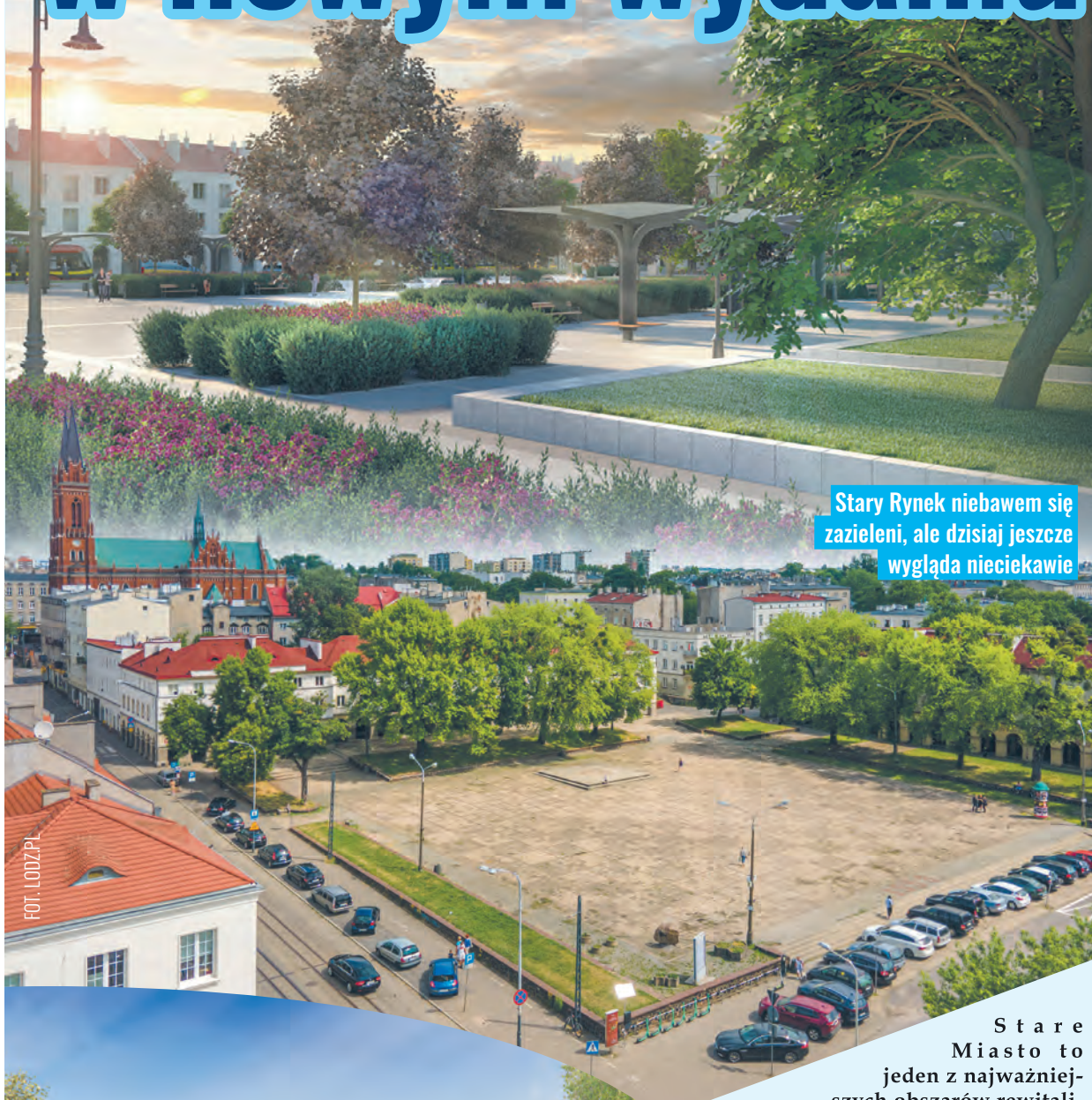
Stary Rynek niebawem się zazieleni, ale dzisiaj jeszcze wygląda nieciekawie