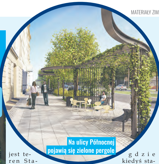
Na ulicy Północnej pojawią się zielone pergole