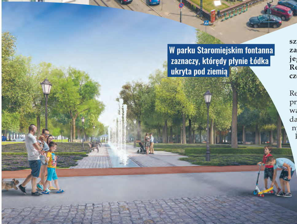
W parku Staromiejskim fontanna zaznaczy, którą płynie Łódka ukryta pod ziemią

jest teren Starego Miasta. g d z i e kiedyś stały kamienice.