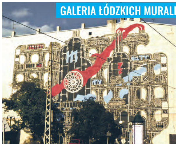
Mural autorstwa M-CITY przy ul. Legionów 19 obok Teatru Powszechnego