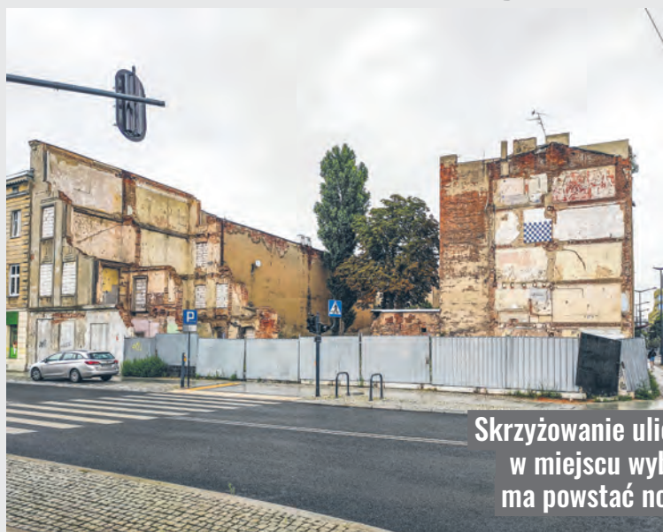
Skrzyżowanie ulic Składowej i POW, w miejscu wyburzonej kamienicy ma powstać nowoczesny budynek