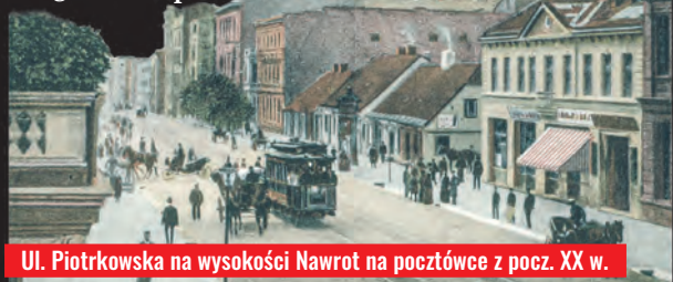
Ul. Piotrkowska na wysokości Nawrot na pocztówce z pocz. XX w.