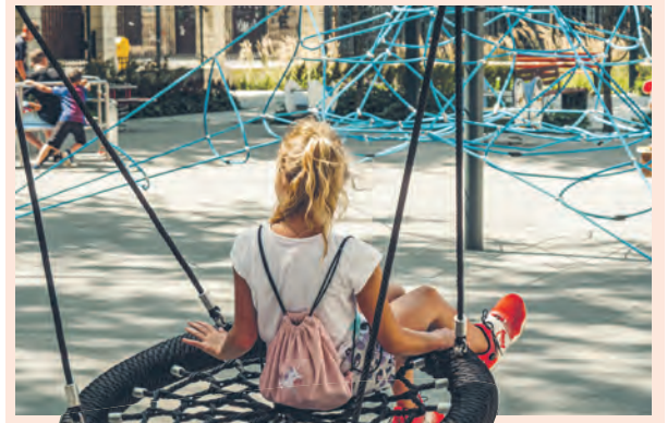
CIEMNA STRONA MIASTA