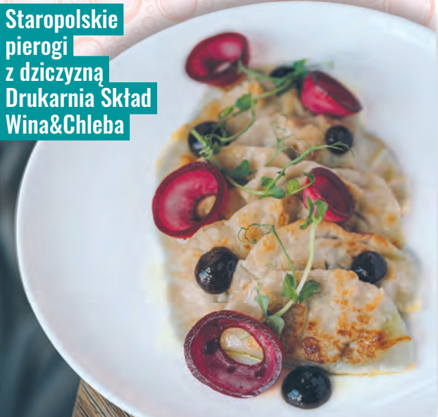
Staropolskie pierogi z dziczyzną Drukarnia Skład Wina&Chleba