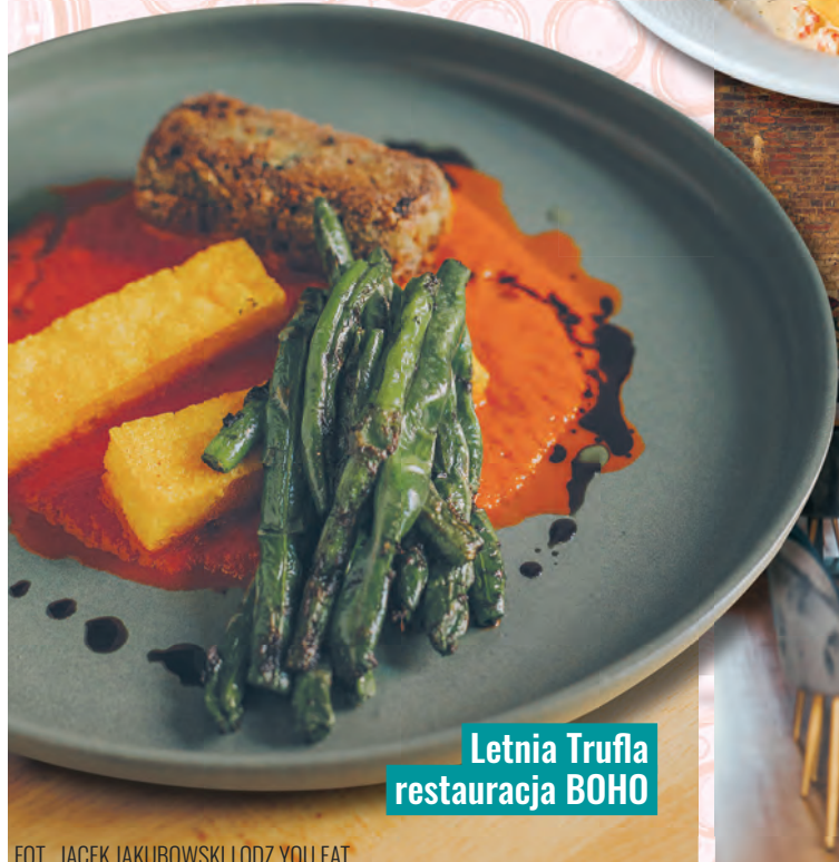
Letnia Truffla restauracja BOHO