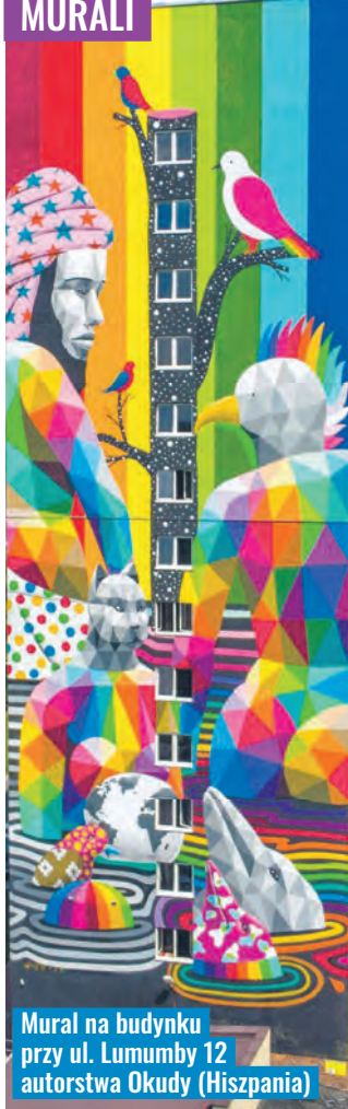
Mural na budynku przy ul. Lumumby 12 autorstwa Okudy (Hiszpania)