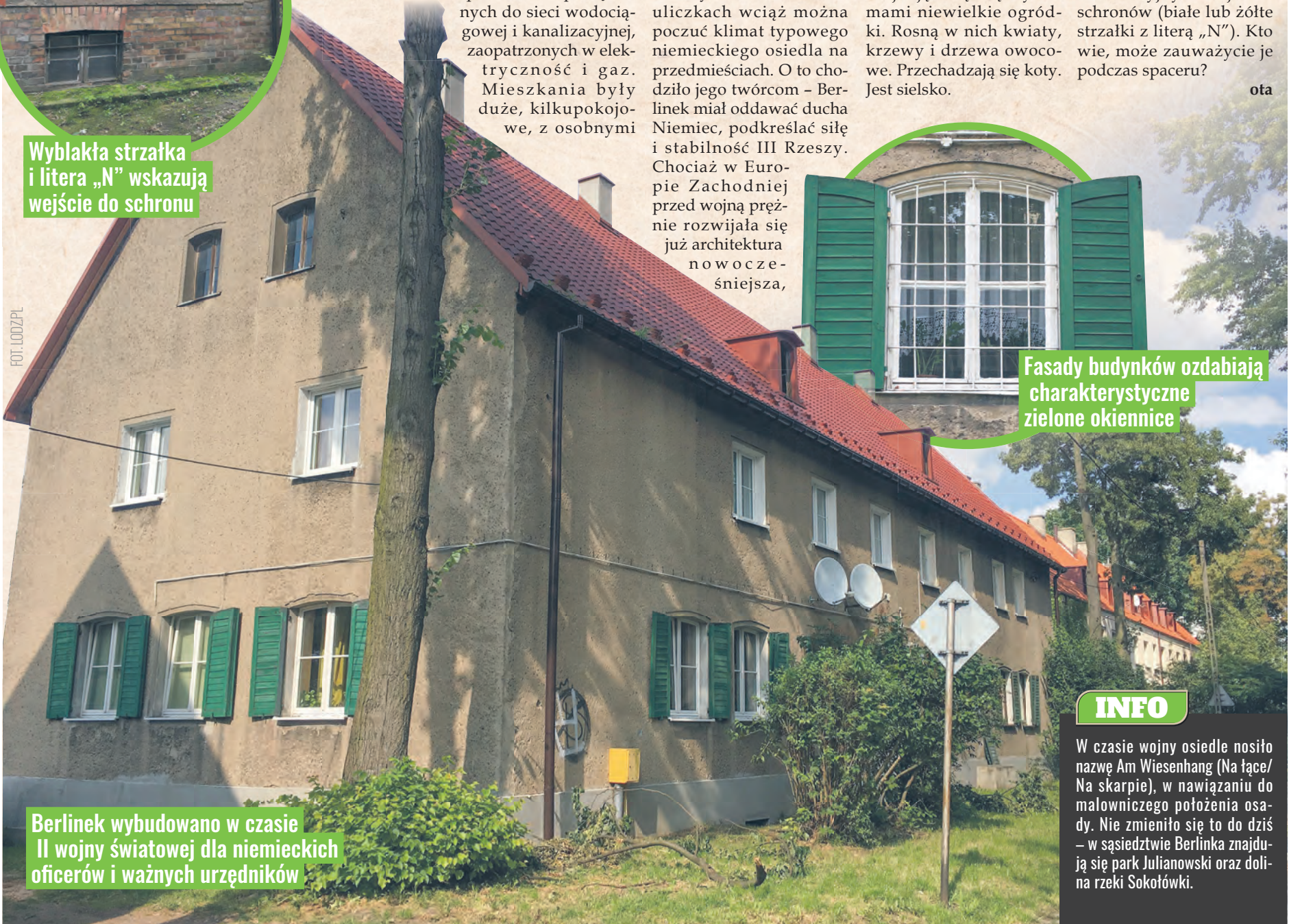
Fasady budynków ozdabiają charakterystyczne zielone okiennice

Berlinek wybudowano w czasie II wojny światowej dla niemieckich oficerów i ważnych urzędników