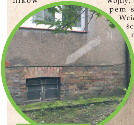
Wyblakła strzałka i litera „N” wskazują wejście do schronu