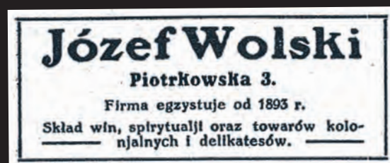
Reklama znanego w Łodzi sklepu z dawnej gazety

się zbytnio, ale urządzili sobie na miejscu libację, gdyż rabusie opróżnili sporo butelek świetnych wódek, a zabrali coś rów-