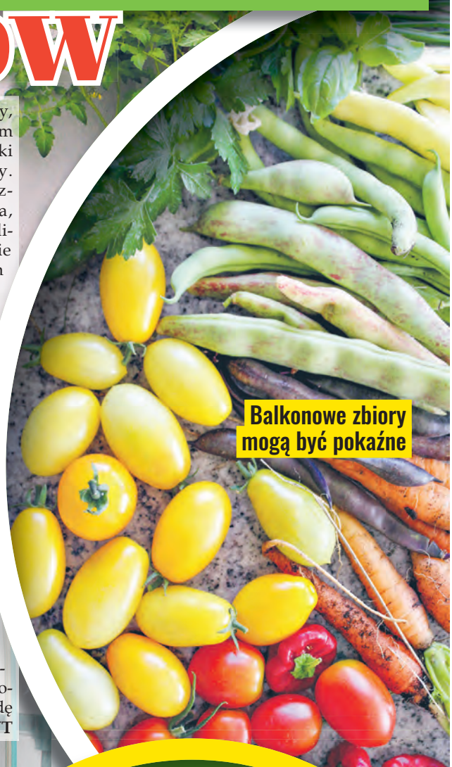
Balkonowe zbiory mogą być okazałe

przeprowadziła warsztaty, a sąsiedzi mogli razem z wiedzą zabrać sadzonki roślin na swoje balkony. Powstała też wewnętrzna grupa facebookowa, na której sąsiedzi mogą liczyć na pomoc i wsparcie w zakresie uprawy tych roślin. Ola pytana, dlaczego to takie ważne, odpowiada: – To jest megaważne w dzisiejszych czasach, kiedy zmiany klimatu postępują tak drastycznie, kiedy spada jakość powietrza i brakuje wilgoci w miastach. Nie możemy przetrwać miast tylko pod siebie, pod ludzi, tu także muszą żyć owady, małe zwierzęta, jeże, a dzięki roślinom poprawia się także komfort oddychania. Dlatego zachęcam wszystkich do własnych balkonowych upraw, to naprawdę nie jest trudne. RUT