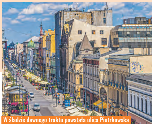
W śladzie dawnego traktu powstała ulica Piotrkowska

do Sulejowa i Piotrkowa. Jak wynika z opisu, w średniowieczu Łódź miała pod względem komunikacyjnym korzystne położenie. Przechodziła przez nią co prawda wyłącznie jedna droga publiczna, ale zagęszczająca się stopniowo w sąsiedztwie sieć połączeń pozwalała na dogodne korzystanie z systemu komunikacyjnego całego kraju. W XV-XVI wieku ukształtowała się ponadto na tym obszarze gęsta sieć dróg lokalnych, łączących przede wszystkim wsie, przysiółki i inne osiedla z siedzibami ich parafii. Zapewne z tych połączeń powstała po XVI w. drogi o charakterze ponadlokalnym, prowadzące z Łodzi do Brzeziny i do Pabianic, a w śladzie dawnego traktu z Łęczycy do Krakowa powstała nasza sławna ulica Piotrkowska. agr