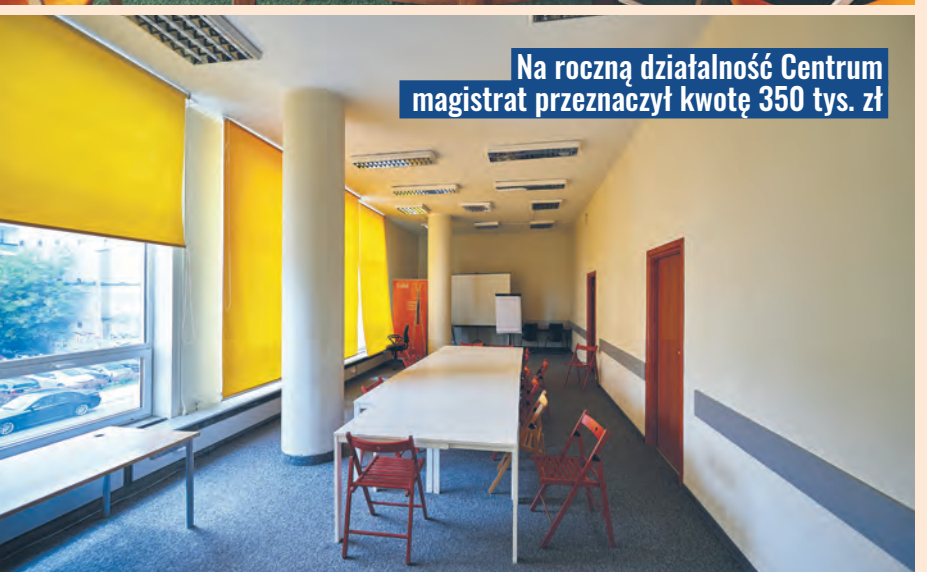
Na roczną działalność Centrum magistrat przeznaczył kwotę 350 tys. zł