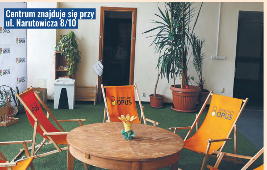
Centrum znajduje się przy ul. Narutowicza 8/10

w Łódzkim Centrum Wielokulturowym dostępna jest także pomoc psychologiczna oraz wsparcie w sytuacji doświadczania przemocy lub dyskryminacji. ŁCW będzie prowadziło także działania pomagające zaaklimatyzować się w mieście, takie jak wycieczki po Łodzi czy imprezy. Na roczną działalność Centrum magistrat przeznaczył kwotę 350 tys. zł. Prowadzeniem Centrum zajmuje się fundacja „Ocalenie”. RUT