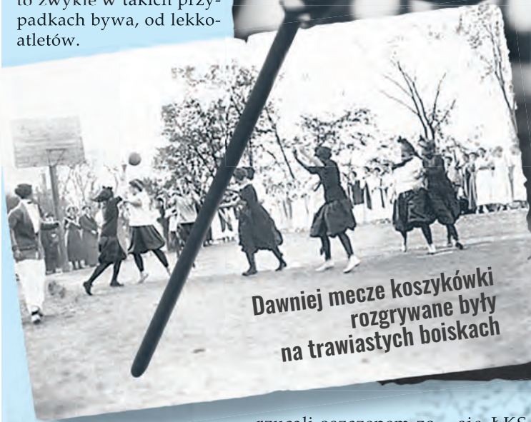
Dawniej mecze koszykówki rozgrywane były na trawiastych boiskach

A przecież nie tylko przy al. Unii uprawiano basket. W latach 20. XX w. w mieście funkcjonowało ponad 30 sekcji koszykarskich. Warto przypomnieć, jak to się stało, że koszykówka w Łodzi zajmuje tak ważne miejsce. A zaczęło się jeszcze przed wojną, jak to zwykle w takich przypadkach bywa, od lekkoatletów.