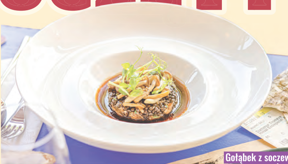
Gołąbek z soczewicy na purée z kalafiora z sosem beurre blanc z winogronem z restauracji Bagatela