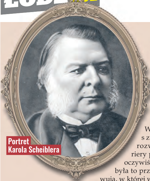
Portret Karola Scheiblera

Karol Scheibler zbudował największe w Łodzi przedsiębiorstwo włókiennicze i jedno z największych w Królestwie Polskim. Jego imperium do dzisiaj zachwyca skalą i rozmachem.