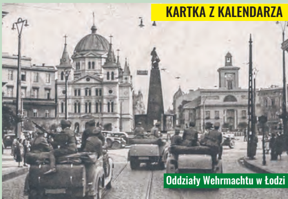
Oddziały Wehrmachtu w Łodzi na pl. Wolności w dniu 8 września 1939 r.