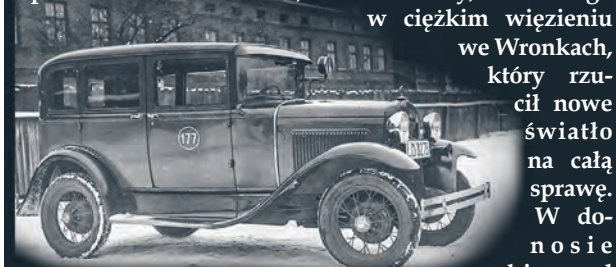
Łódzka taksówka na fotografii z 1933 roku

Latem 1929 roku dwaj młodzi mężczyźni wracali rowerami z niedzielnego pikniku w Wiśniowej Górze, która była jednym z ulubionych miejsc wypoczynku łodzian. Na wysokości Henrykowa, kilkadziesiąt metrów od szosy rokicińskiej zauważyli stojący w szczerym polu samochód z zapalonym silnikiem i światłami. Gdy podjechali bliżej, okazało się, że to łódzka taksówka opatrzona numerem 52,