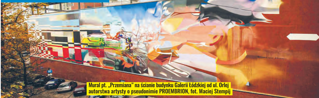
Mural pt. „Przemiana” na ścianie budynku Galerii Łódzkiej od ul. Orlej autorstwa artysty o pseudonimie PROEMBRION