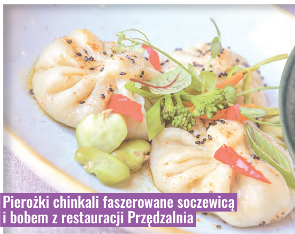
Pierogi chinkali faszerowane soczewicą i bobem z restauracji Przędzalnia