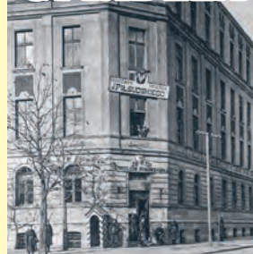
Koszary 28 Pułku Strzelców Kaniowskich w międzywojniu

To już chyba nieużywana w Łodzi nazwa na określenie kompleksu czynszowych kamienic w rejonie ulic Żeligowskiego i 6 Sierpnia, choć adekwatna do ówczesnej topografii miasta. Bo chociaż te budynki mieszkalne należały do prywatnych właścicieli i były podnajmowane robot-