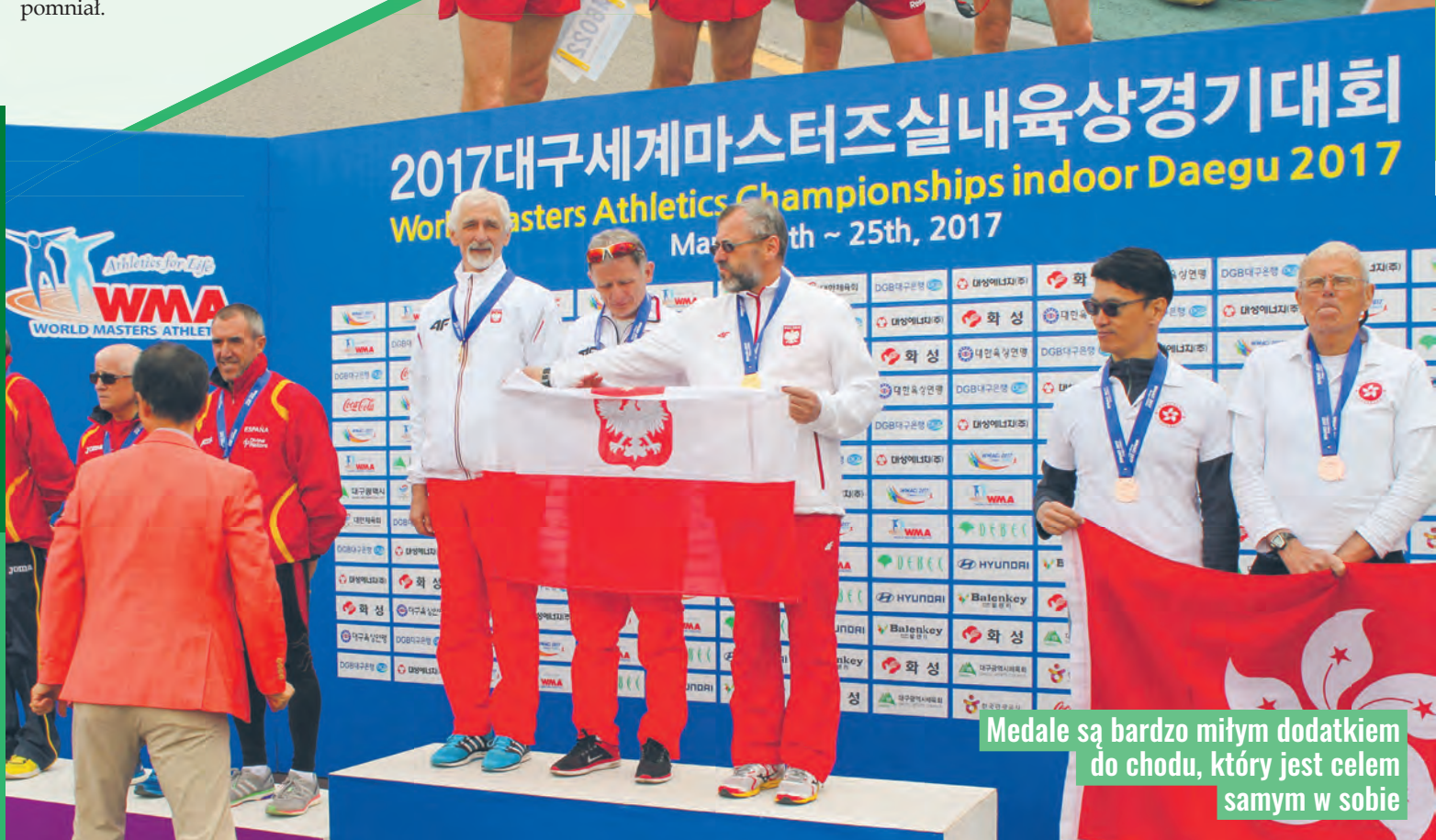
Medale są bardzo miłym dodatkiem do chodu, który jest celem samym w sobie