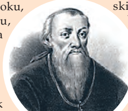
Biskup włocławski Jakub Uchański

W zasadzie od aktów lokacyjnych miasta i ich renowacji w XV w. aż do połowy XVI w. nie zachowały się żadne zapisy dotyczące Łodzi. Dopiero w 1561 roku, we Włocławku, 12 października biskup Jakub Uchański (ur. w 1502 r.), od 1562 r. prymas Polski, stronnik królowej Bony, pierwszy interrex polski) wydaje specjalny dokument, będący odpowiedzią ubożającym i żyjącym