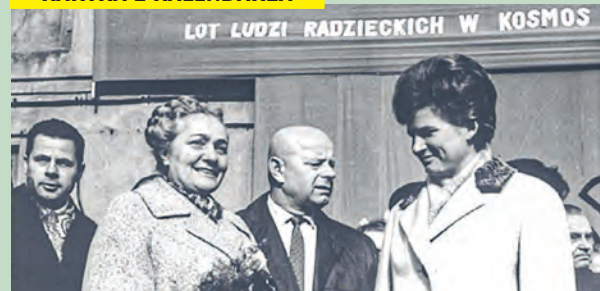
Walentyna Tierszkowa (z prawej) w Łódzkich Zakładach Przemysłu Odzieżowego im. Małgorzaty Fornalskiej