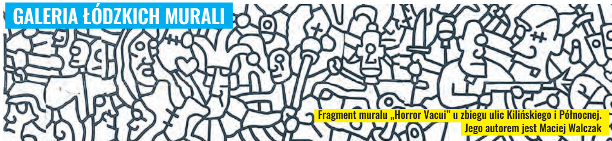
Fragment muralu „Horror Vacui” u zbiegu ulic Kilińskiego i Północnej. Jego autorem jest Maciej Walczak