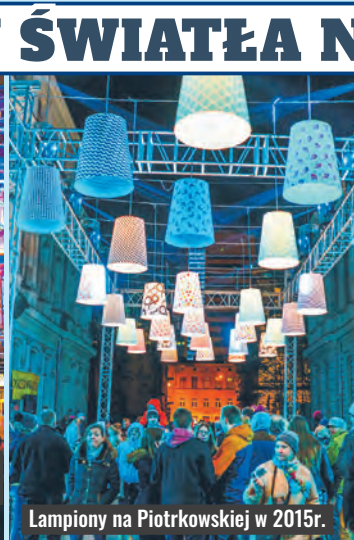
Lampiony na Piotrkowskiej w 2015r.

27 października 2011 r. zainaugurowano pierwszą edycję „Light.Move. Festival”, czyli Festiwalu Kinetycznej Sztuki Światła.