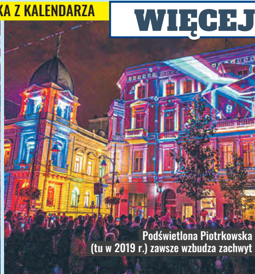
Podświetlona Piotrkowska (tu w 2019 r.) zawsze wzbudza zachwyt