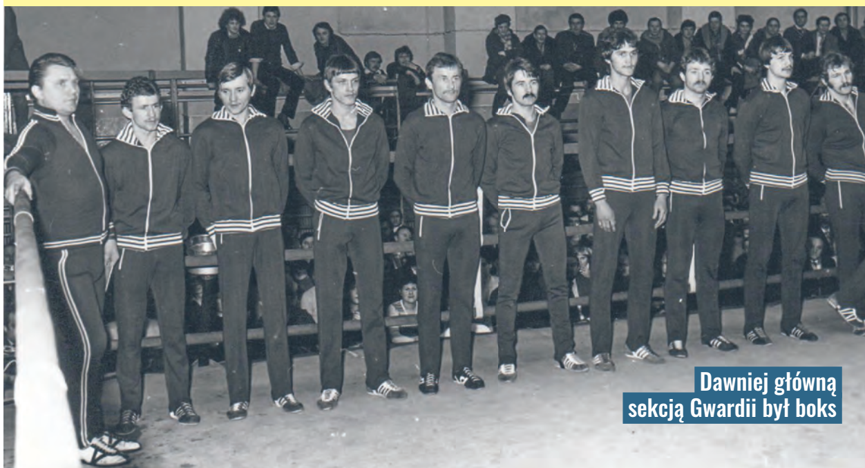
Dawniej główną sekcją Gwardii był boks