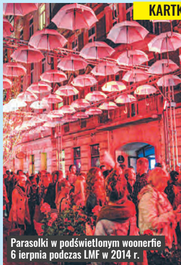
Parasolki w podświetlonym wooneferie 6 sierpnia podczas LMF w 2014 r.