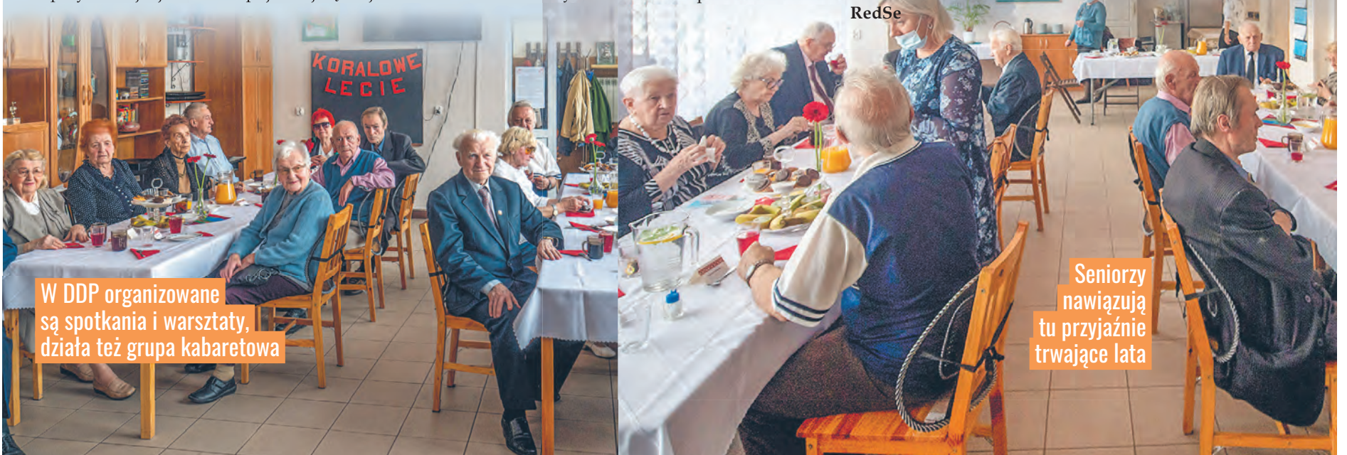
W DDP organizowane są spotkania i warsztaty, działa też grupa kabaretowa