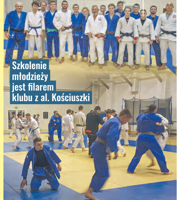
Szkolenie młodzieży jest filarem klubu z al. Kościuszki