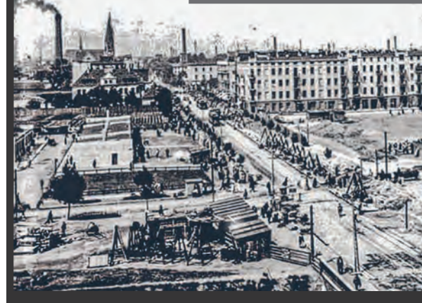
Okolice Górniaka w latach 30. XIX w.

Dopiero interwencja z narażeniem życia posterunkowego z XIII Komisariatu przyniosła kres masakrze dokonanej przez pijanego gościa... agr