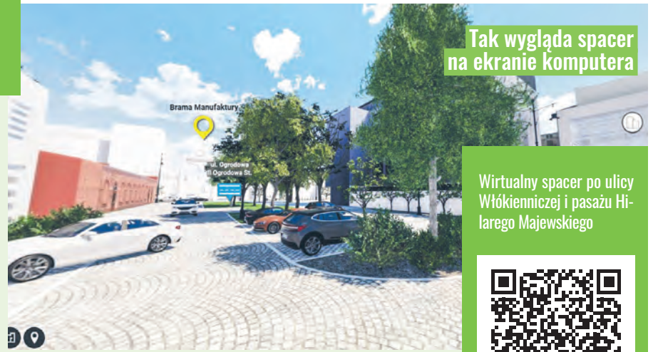
Tak wygląda spacer na ekranie komputera

Wirtualny spacer po ulicy Włókienniczej i pasażu Hilarego Majewskiego