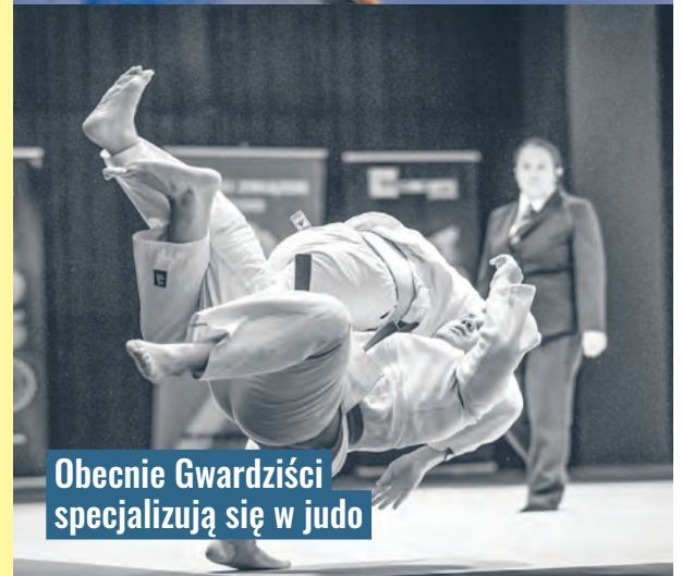
Obecnie Gwardziści specjalizują się w judo