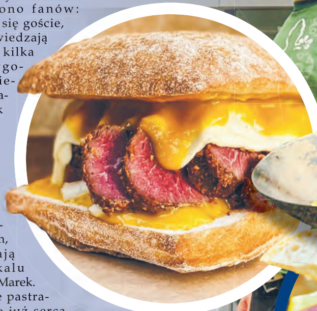
Pastrami z serem, ogórkiem, a nawet kapustą kiszoną - każdy znajdzie swoją ulubioną kanapkę