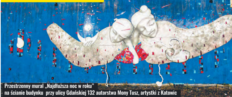
Przestrzenny mural „Najdłuższa noc w roku” na ścianie budynku przy ulicy Gdańskiej 132 autorstwa Mony Tusz, artystki z Katowic