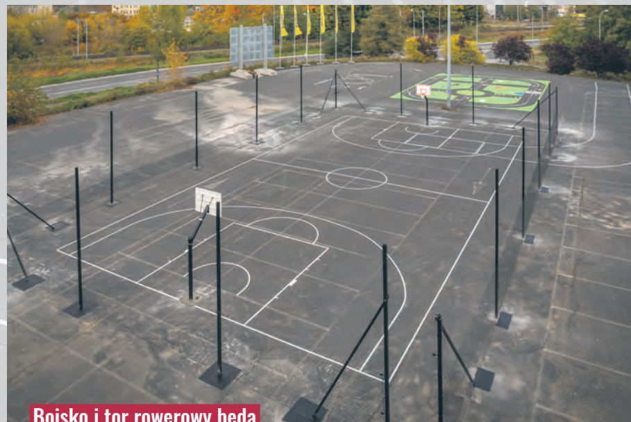
Boisko i tor rowerowy będą działać kilka lat