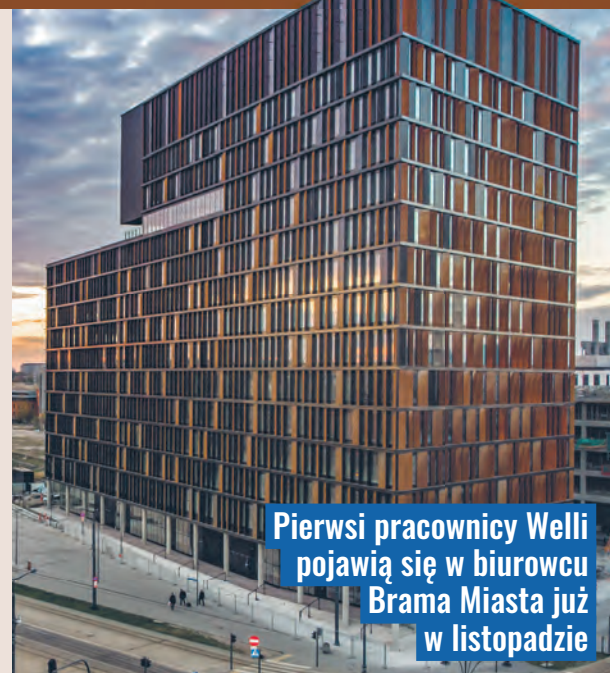
Pierwsi pracownicy Welli pojawią się w biurowcu Brama Miasta już w listopadzie