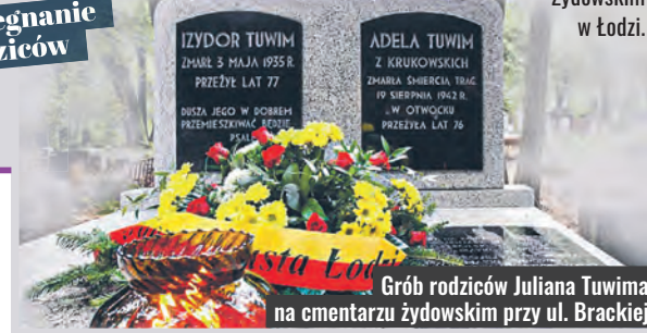
Grób rodziców Juliana Tuwima na cmentarzu żydowskim przy ul. Brackiej