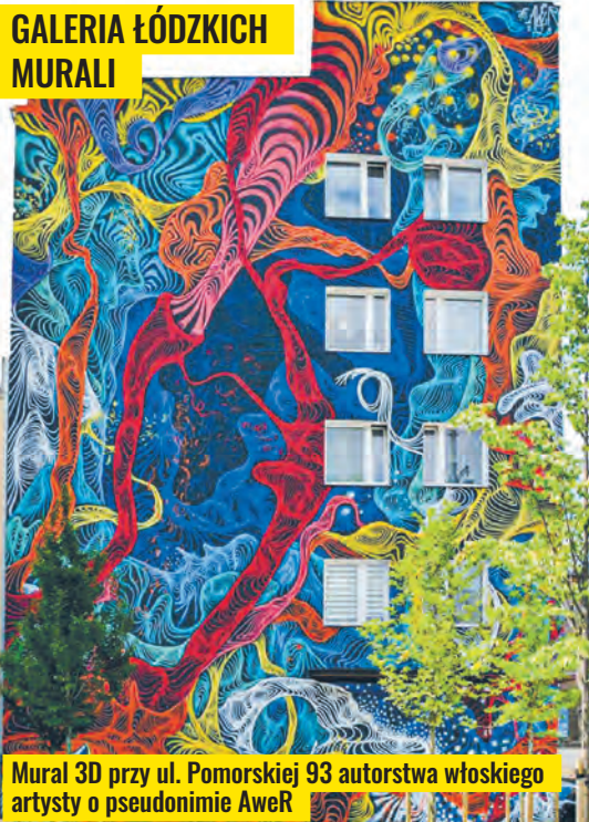
Mural 3D przy ul. Pomorskiej 93 autorstwa włoskiego artysty o pseudonimie AweR