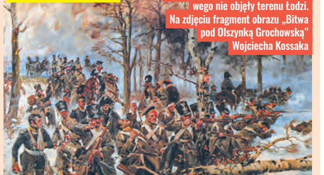
Walki podczas powstania listopadowego nie objęły terenu Łodzi. Na zdjęciu fragment obrazu „Bitwa pod Olszynką Grochowską” Wojciecha Kossaka