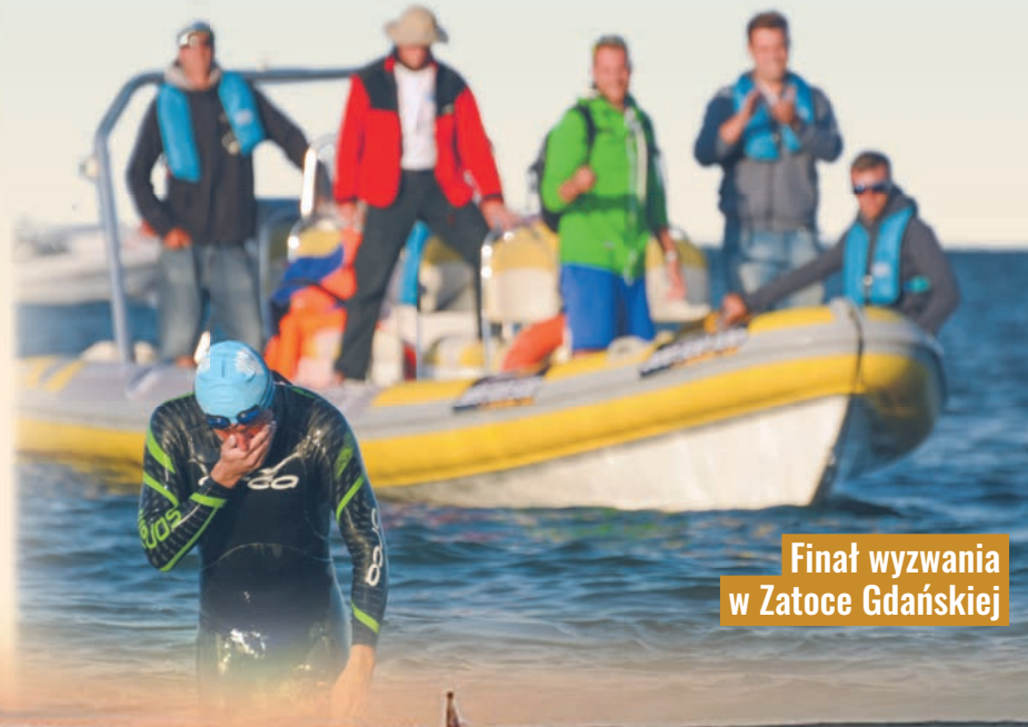
Finale wyzwania w Zatoce Gdańskiej