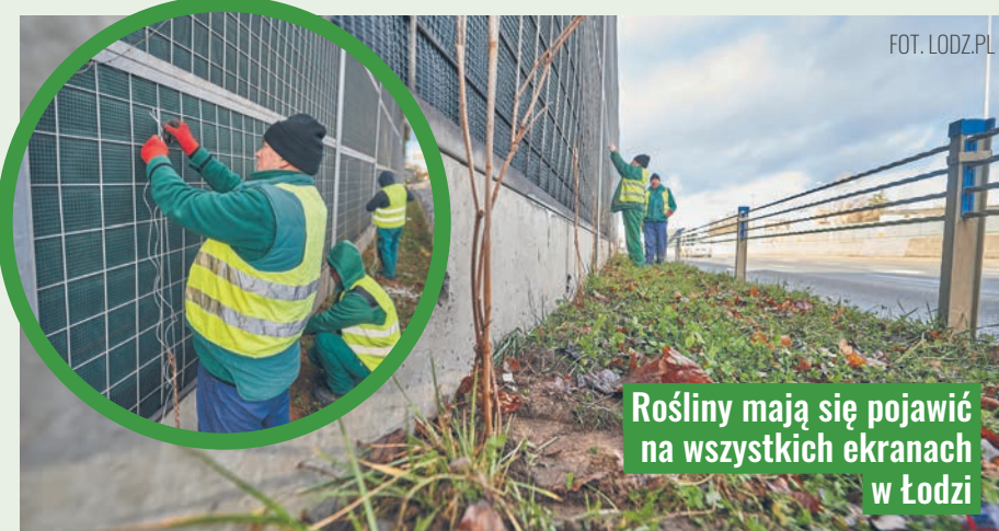
Rośliny mają się pojawić na wszystkich ekranach w Łodzi