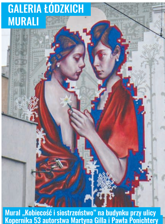
Mural „Kobiecość i siostrzeństwo” na budynku przy ulicy Kopernika 53 autorstwa Martyna Gilla i Pawła Ponichtery