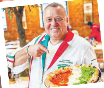
La Mia Fabbrica