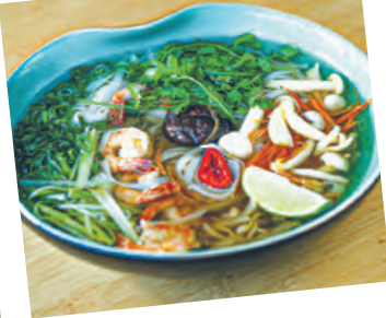
Pho by Lilly Tran