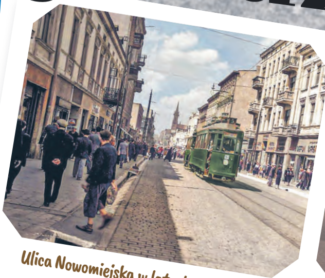
Ulica Nowomiejska w latach 30. (koloryzowane) i stan dzisiejszy