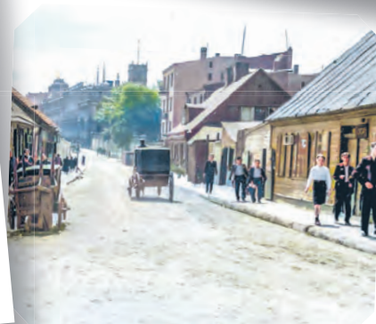
Ulica Stodolniana w latach 30. Obecnie jako fragment ulicy Zachodniej. Zdjęcie archiwalne autorstwa Włodzimierza Pfeiffera (koloryzowane)