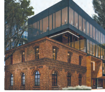
XS Wigury Office