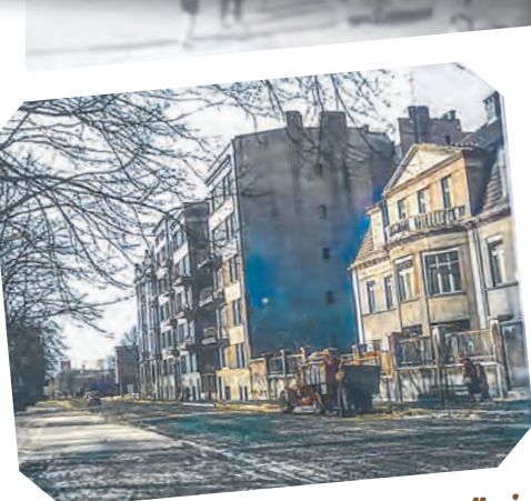
Ulica Jaracza w czasie okupacji niemieckiej (lata 40.). Zdjęcie koloryzowane