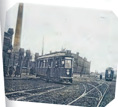
Skwer przed Dworcem Fabrycznym, fot. Włodzimierz Pfeiffer, lata 30 XX w. i Dworzec Fabryczny w roku 2021