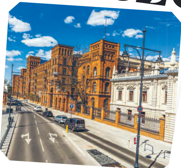
Brama przędzalni Poznańskiego. Ostatnia dekada XIX w. i współcześnie