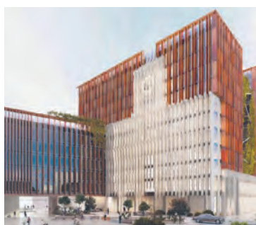
Projekt Nowego Ratusza