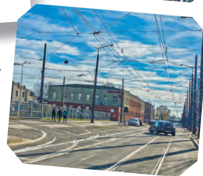
Ulica Tramwajowa lata 20-30.