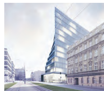
Hotel przy Kilińskiego 83