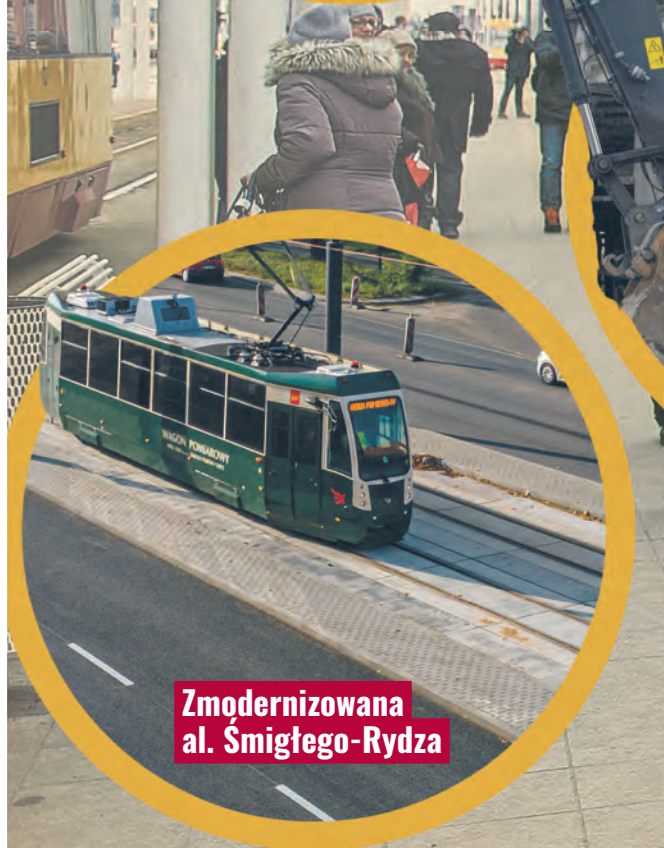
Zmodernizowana al. Śmigłego-Rydza

W tym roku rozpocznie się przebudowa kolejnych 6 km torowisk. To część dużego programu, który obejmuje inwestycje na połowie łódzkiej sieci tramwajowej.