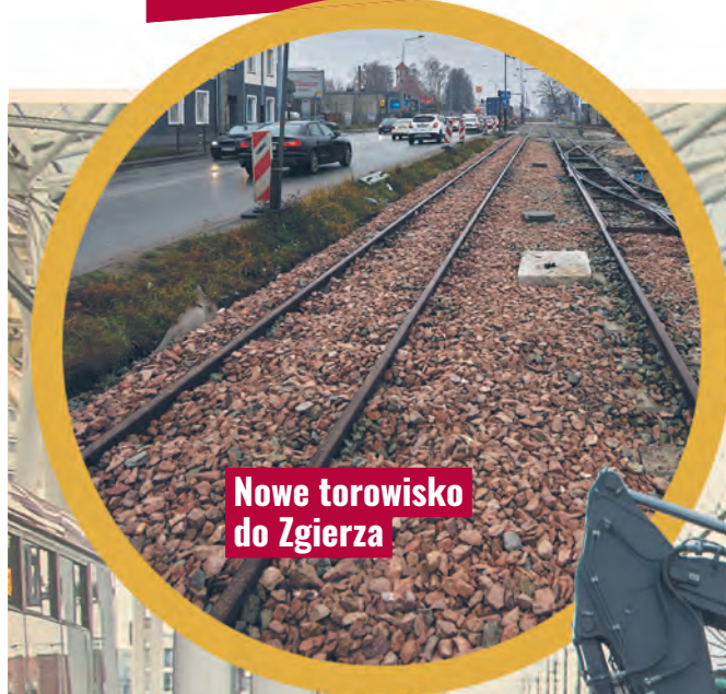
Nowe torowisko do Zgierza