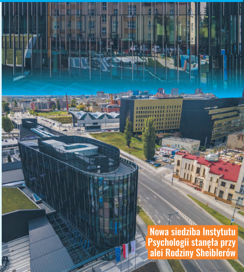
Nowa siedziba Instytutu Psychologii stanęła przy alei Rodziny Scheiblerów