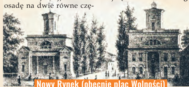
Nowy Rynek (obecnie plac Wolności)