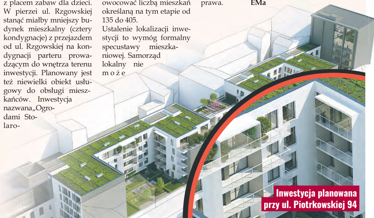
Inwestycja planowana przy ul. Piotrkowskiej 94

odrzuć wniosku, który jest zgodny z przepisami prawa. EMa