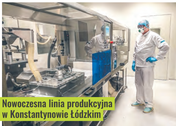
Nowoczesna linia produkcyjna w Konstancynie Łódzkim