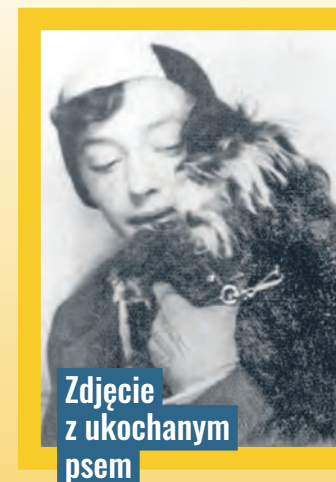
Zdjęcie z ukochanym psem