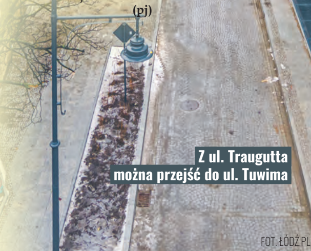
Z ul. Traugutta można przejść do ul. Tuwima