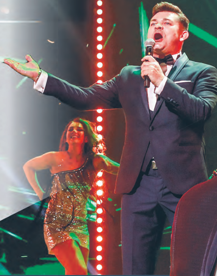
fol. Artur Kraszewski, Bartosz Kulisowski Photography