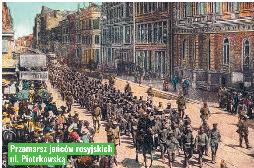
Przemarsz jeńców rosyjskich ul. Piotrkowską