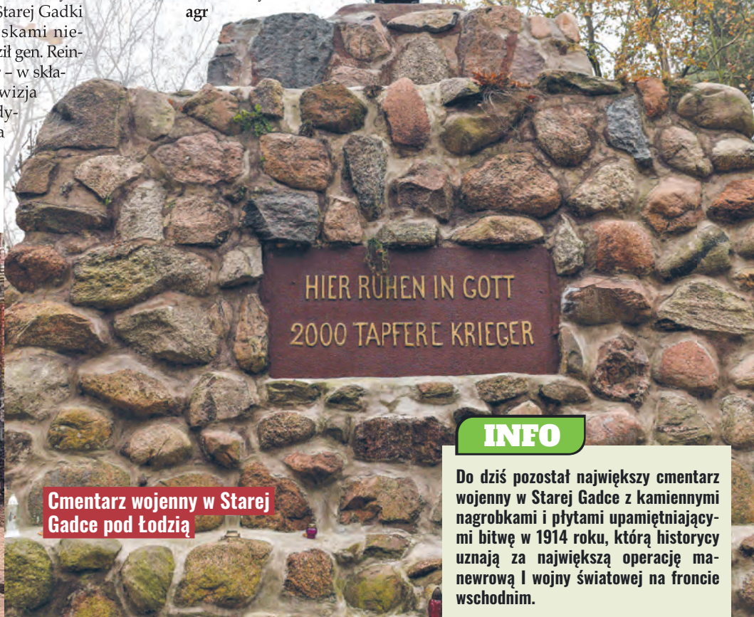
Cmentarz wojenny w Starej Gadce pod Łodzią