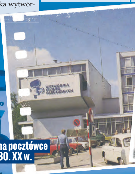
WFF na pocztówce z lat 80. XX w.

FOT. MAT. WOJEWÓDZKA BIBLIOTEKA PUBLICZNA W ŁÓDZI