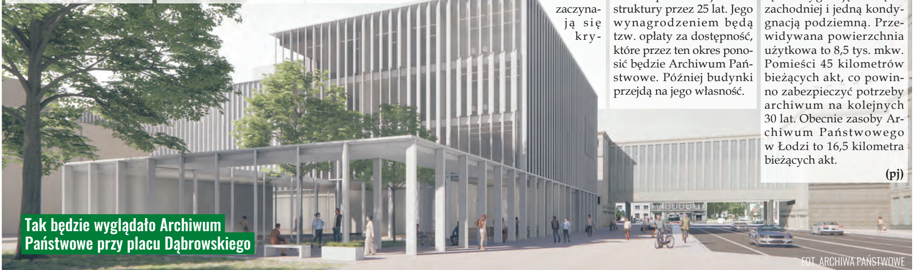
Tak będzie wyglądało Archiwum Państwowe przy placu Dąbrowskiego