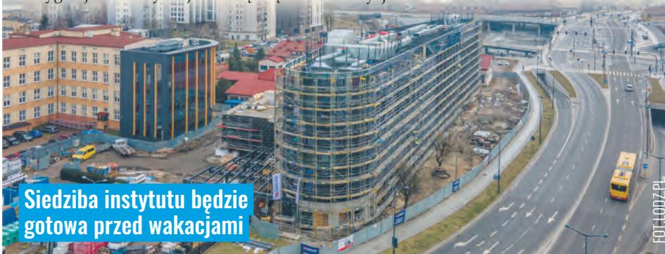
Siedziba instytutu będzie gotowa przed wakacjami