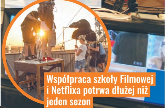
Współpraca szkoły Filmowej i Netflixu potrwa dłużej niż jeden sezon