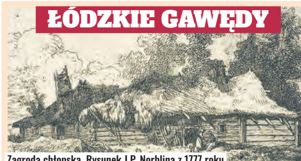
Zagroda chłopska. Rysunek J.P. Norblina z 1777 roku