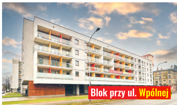
Blok przy ul. Wspólnej