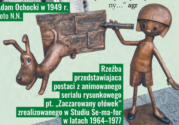
Rzeźba przedstawiająca postaci z animowanego serialu rysunkowego pt. „Zaczarowany ołówek” zrealizowanego w Studiu Se-ma-for w latach 1964–1977

cia, kolegów, przyjaciół i ob-raz ówczesnej Łodzi. Zmarł 11 XII 1991 r. w Łodzi i jest pochowany na cmentarzu na Dołach. W jednym z wywiadów tak mówił o pracy w przedwojennej łódzkiej prasie: „Mój redaktor udzielił mi wskazówki: jak pies pogryzie człowieka – wzmianka na pięć wierszy, jak człowiek psa – pisz pan pół kolumny...” agr