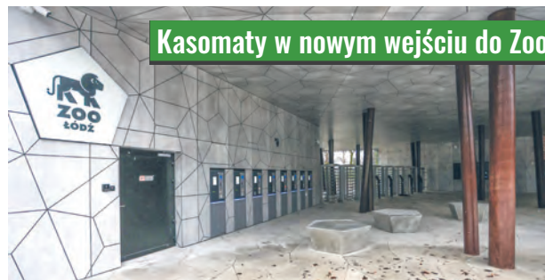
Kasomaty w nowym wejściu do Zoo

Łódź dofinansuje w tym roku remonty 23 kamienic należących do wspólnot mieszkańców i prywatnych właścicieli znajdujących się w Specjalnej Strefie Rewitalizacji. Magistrat wyłoży na ten cel blisko 5 mln zł.