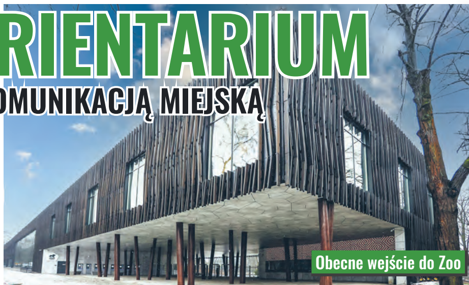
Obecne wejście do Zoo

Wraz z otwarciem nowych atrakcji Łódzkiego Zoo, komunikacja miejska zapewni wygodny dojazd na Zdrowie. Oprócz funkcjonujących obecnie linii 43A, 43B, 72A, 72B, 76, 83, 97A, 97B, 6MUK, kursujących wokół parku im. Piłsudskiego łodzianie będą mogli skorzystać z dodatkowych linii