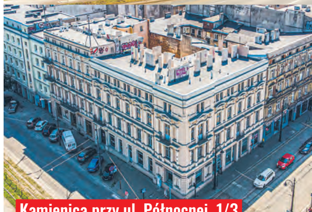
Kamienica przy ul. Północnej 1/3