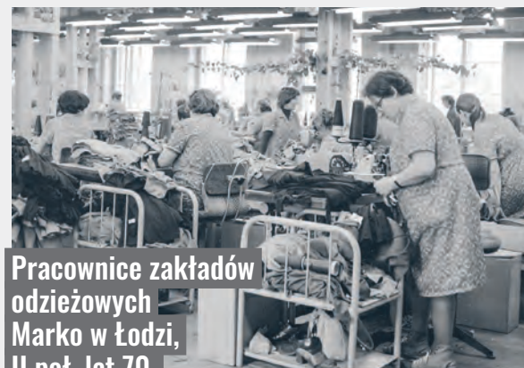
Pracownice zakładów odzieżowych Marko w Łodzi, II poł. lat 70.

welnianego im. J. Marchlewskiego, w kolejnych dniach dołączyły kolejne. W sumie zastrajkowały załogi 32 fabryk, m.in. ZPB im. Obrońców Pokoju, im. 1 Maja, im. Armii Ludowej, im. Feliksa Dzierżyńskiego, im. Harnama oraz kilkanaście innych przedsiębiorstw przemysłu wełnianego i dziewiarskiego. W kulminacyjnym momencie, 15 lutego protestowało