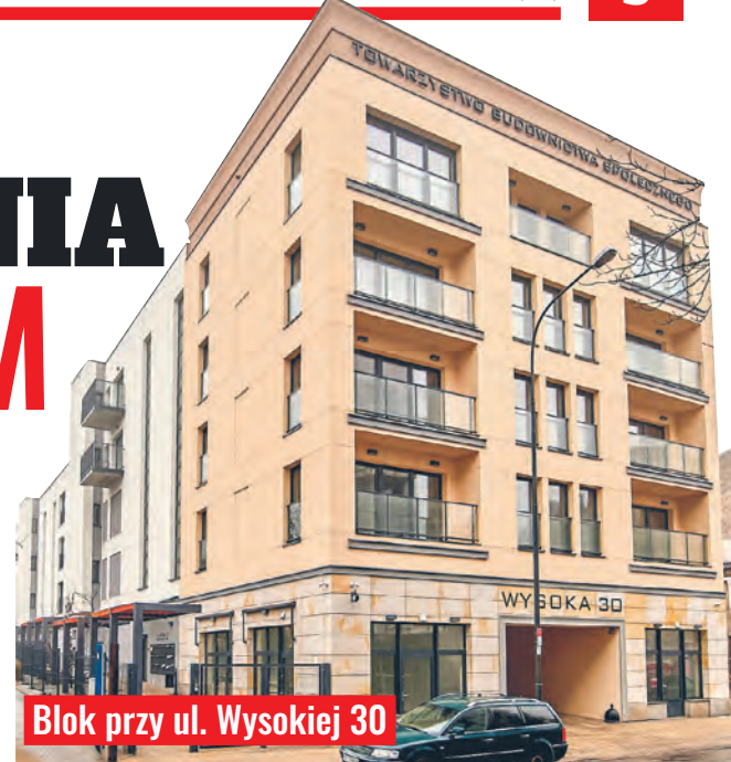
Blok przy ul. Wysokiej 30

Na tle rządowego funduszu korzystnie wypada oferta dwóch miejskich spółek. Od 15 do 23