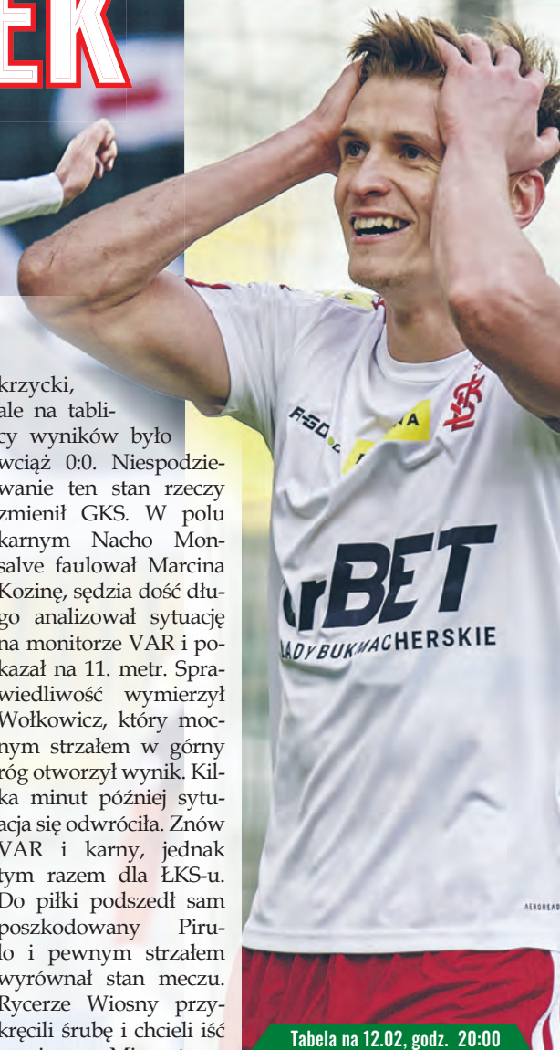
Tabela na 12.02, godz. 20:00