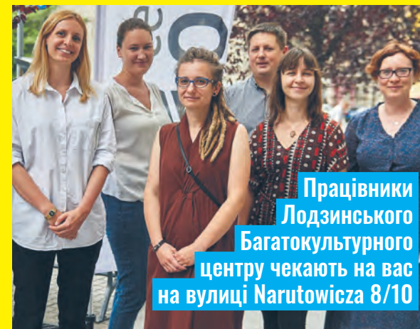
Працівники Лодзинського Багатокультурного центру чекають на вас на вулиці Narutowicza 8/10

Команда ŁCW за своїм складом мультикультурна – вона також складається з мігрантів з України та Білорусі. Ми розмовляємо п'ятьма мовами: польською, англійською, російською, українською та білоруською; ми допомагаємо з необхідним усним та письмовим перекладом. Нашими консультаційними послугами користуються переважно мігранти та мігрантки, а також люди з досвідом біженців.