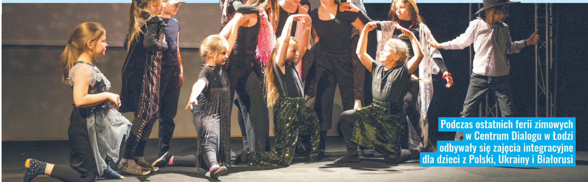
Podczas ostatnich ferii zimowych w Centrum Dialogu w Łodzi odbywały się zajęcia integracyjne dla dzieci z Polski, Ukrainy i Białorusi