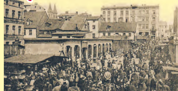
Ulica Wschodnia w Łodzi na starej fotografii

Łódki, gdzie właśnie było wspomniane targowisko, które od 1940 roku znalazło się w granicach Litzmanstadt Getto. Co więcej, w 1928 roku podjęto decy-