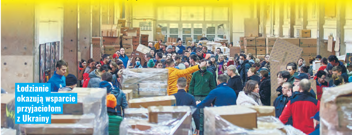
Łodzianie okazują wsparcie przyjaciółom z Ukrainy