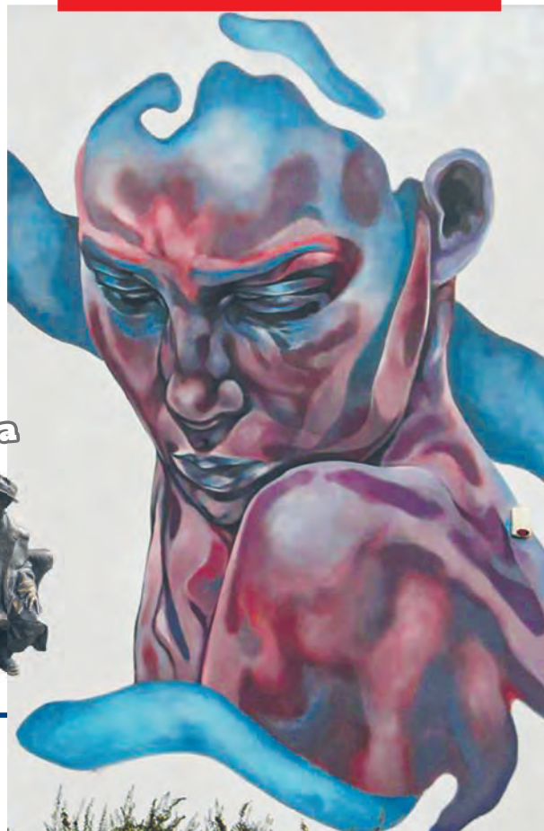
Mural „Leczenie” przy ulicy Brzechwy 3 autorstwa artystki Paoli Delfin pochodzącej z Meksyku