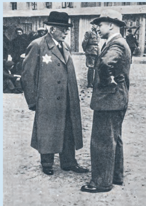
Chaim Rumkowski i Hans Biebow – szef niemieckiej cywilnej administracji w Litzmannstadt Ghetto

również funkcję prezesa zarządu Internatu dla Dzieci Żydowskich i Fermi w „Helenówku”, przy obecnej ul. Krajowej 15. W latach 30. był członkiem zarządu Gminy Żydowskiej w Łodzi i działaczem syjonistycznym.