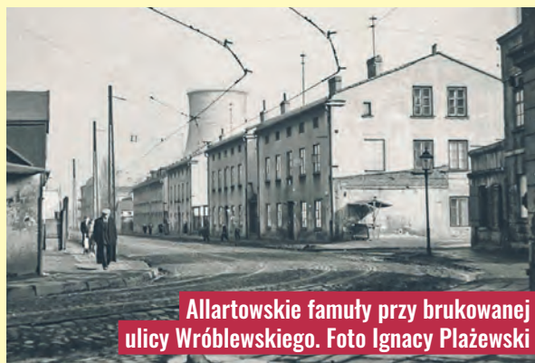
Allartowskie famuły przy brukowanej ulicy Wróblewskiego.

inzla przy ul. Tuwima, budynki przy Niciarce i na Grynbaclu, osiedle na Mani, czy mniejsze skupiska tego typu domków w pobliżu wielu łódzkich fabryk. Stanowią one nieodłączną część łódzkiego pejzażu, a wiele z nich zostało zrewitalizowanych i nadal są zamieszkałe lub pełnią funkcję użytkowe. Famułki – jak również zdrobniałe w Łodzi mówiono – to kawał historii naszego miasta i żywa księga losów wielu pokoleń robotników – mieszkańców wielkiej przemysłowej aglomeracji. agr