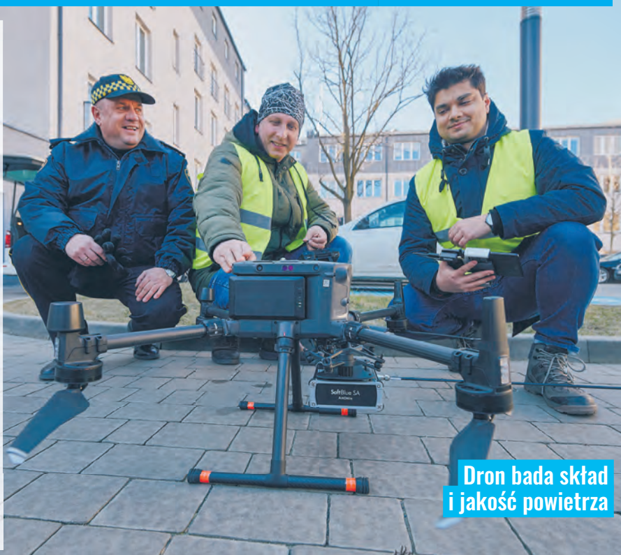
Dron bada skład i jakość powietrza