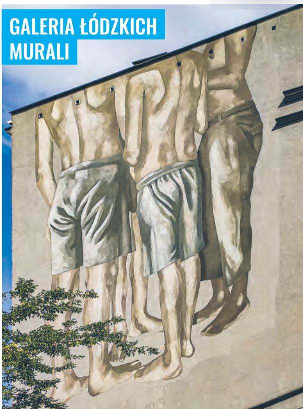
Mural „Occupied spaces” argentyńskiej artystki o ps. HYURO na ścianie kamienicy przy ul. Cmentarnej 3 A