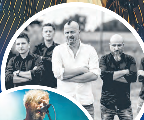
Strachy na Lachy