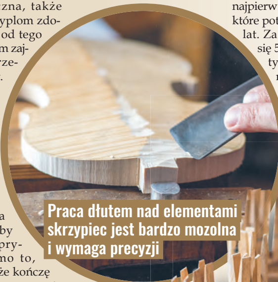
Praca dłutem nad elementami skrzypiec jest bardzo mozolna i wymaga precyzji