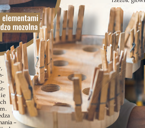
Łączenie pośrodku skrzypiec oznacza, że zostały zrobione z dwóch kawałków drewna