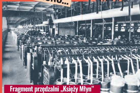
Fragment przędzalni „Księży Młyn”