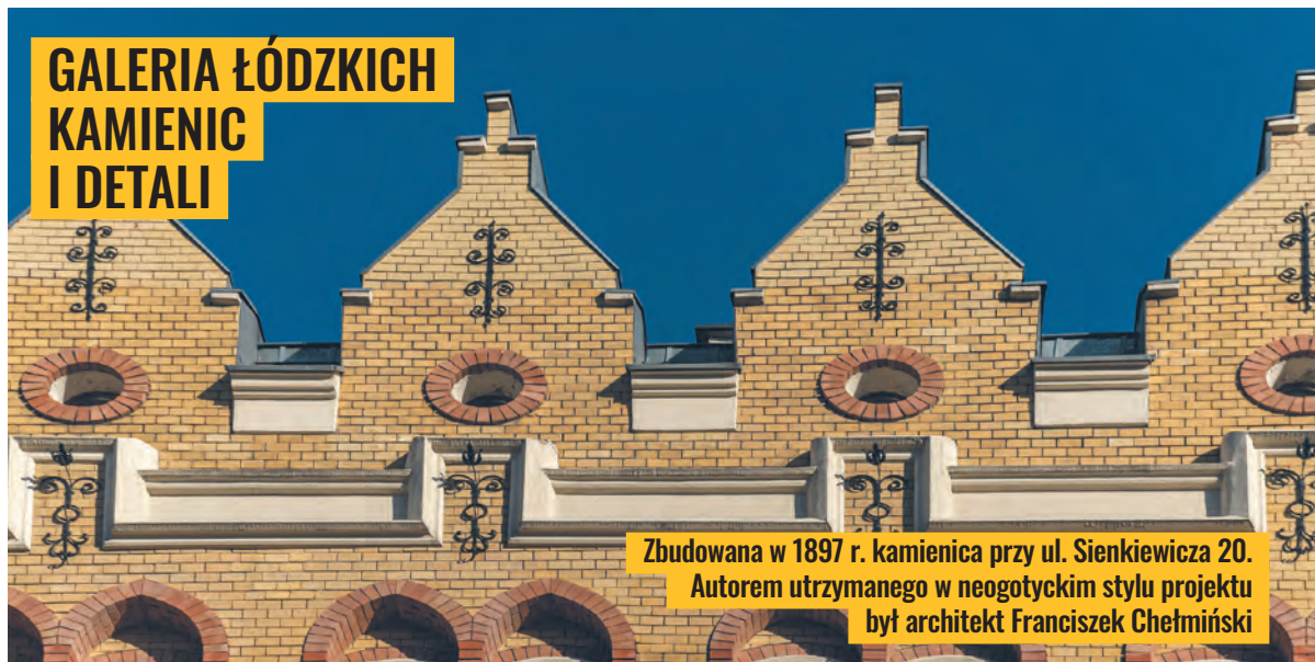
Zbudowana w 1897 r. kamienica przy ul. Sienkiewicza 20. Autorem utrzymanego w neogotyckim stylu projektu był architekt Franciszek Chełmiński