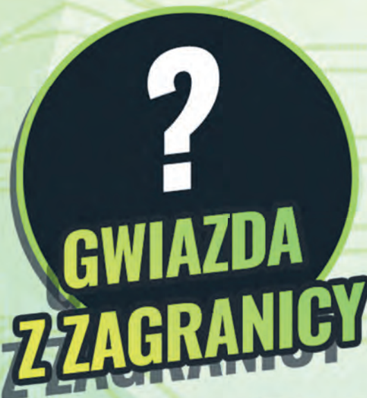
GWIAZDA Z ZAGRANICY