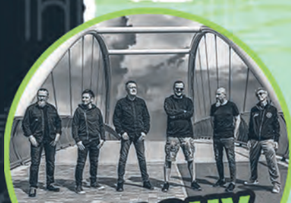
STRACHY NA LACHY