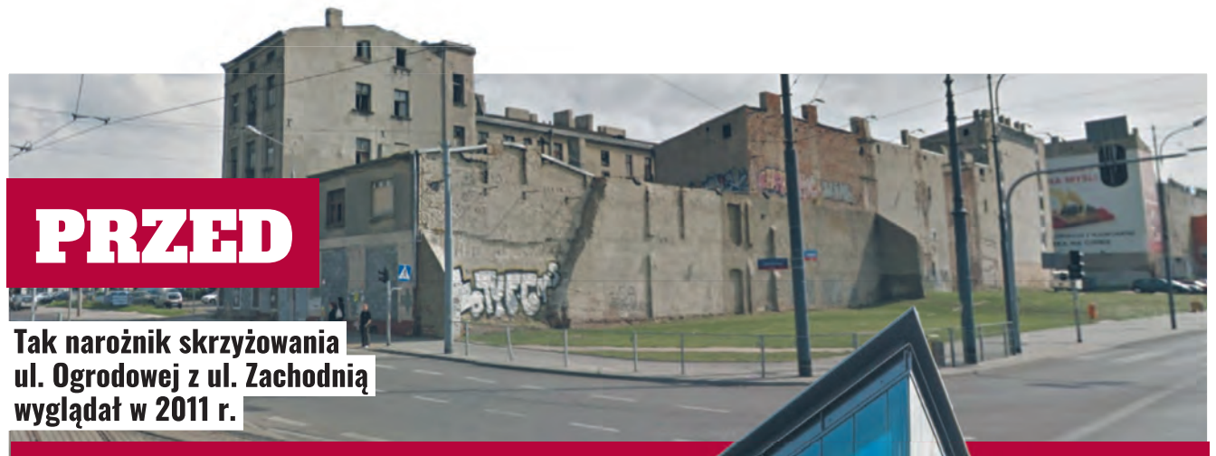
PRZED Tak narożnik skrzyżowania ul. Ogrodowej z ul. Zachodnią wyglądał w 2011 r.

zagospodarowania przestronnego jest przeznaczona pod zabudowę mieszkaniowo-usługową. Już poza NCL, ale wciąż w Strefie Wielkomięskiej proponowana będzie inwestorom nieruchomości przy ul. Wschodniej 48/50, leżąca w samym centrum inwestycji gminnego programu obszarowej rewitalizacji miasta, tuż obok całkowicie przeobrażonej ul. Włókienniczej. Do zaopinionowania jest tam 0,3 ha pod zabudowę mieszkaniowo-usługową.