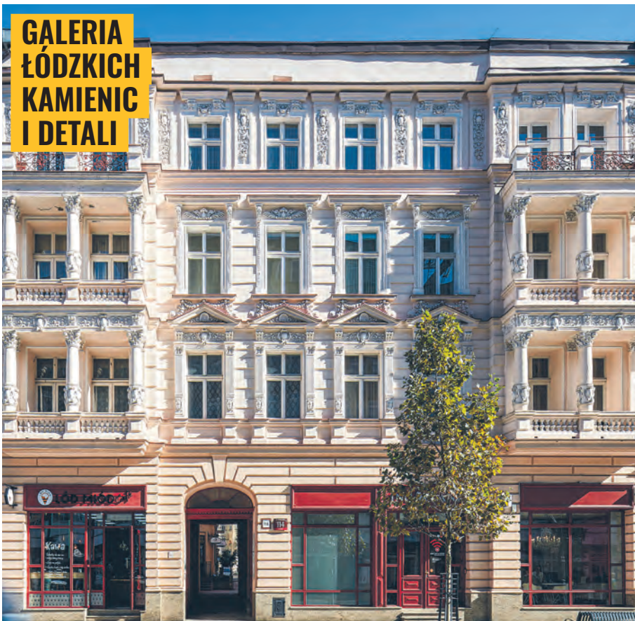
Neorenesansowa kamienica Jonasza Warszawskiego przy ul. Piotrkowskiej 114 zbudowana w 1893 r. wg projektu Ignacego Markiewicza