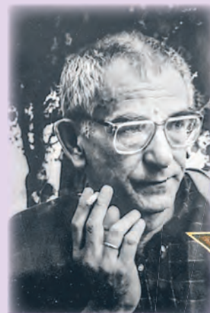
Krzysztof Kieślowski na Festiwalu Filmowym w Wenecji w 1994 r. oraz jego gwiazda w Alei Gwiazd na ul. Piotrkowskiej

„Dekalog” z lat 80., a „Podwójne życie Weroniki” i „Trzy kolory” (pocz. lat 90.) dotyczyły materii egzystencjalnej i metafizycznej. Były oczywiście liczne nagrody i wyróżnienia na europejskich festiwalach, jak również nominacje do Oscara. Z dzisiejszej perspektywy zastanawiające jest jednak, co jeszcze mogłby Kieślowski nakręcić, gdyby nie jego przedwczesna śmierć. Reżyser urodził się 27 czerwca 1941 r. w Warszawie, a zatem odszedł w wieku zaledwie 54 lat, w pełni sił twórczych, kończąc zbyt krótki film o życiu. agr