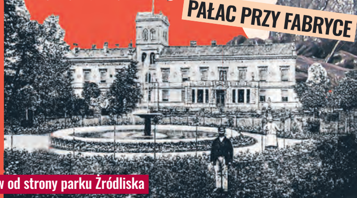
PAŁAC PRZY FABRYCE

zielenią parku Źródlika, pełniąc rolę niedużej, ale wygodnej i położonej blisko fabryki miejskiej rezydencji. agr