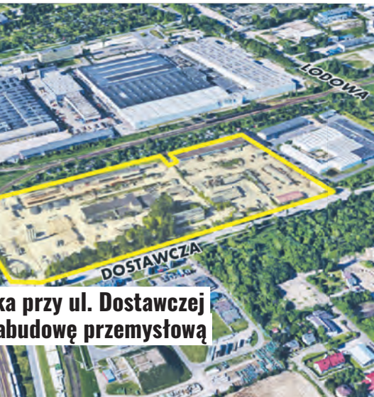
...ka przy ul. Dostawczej ...budowę przemysłową