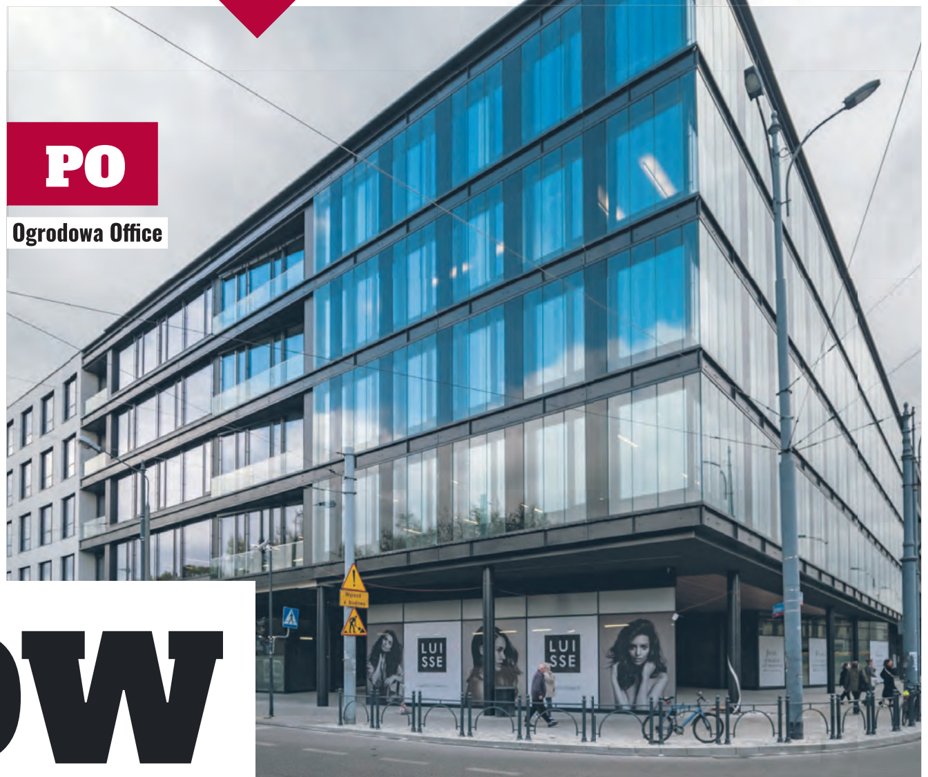
PO Ogrodowa Office