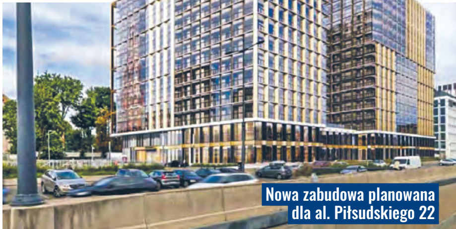
Nowa zabudowa planowana dla al. Piłsudskiego 22

Pierwszym z nich jest projekt, który opisywaliśmy już na łamach „Łódź.pl” – chodzi o kompleks, który warszawski deweloper, Prime Łódź 1, chce wznieść przy al. Piłsudskiego 22. Ma tam powstać zespół wysokich budynków mieszkalnych