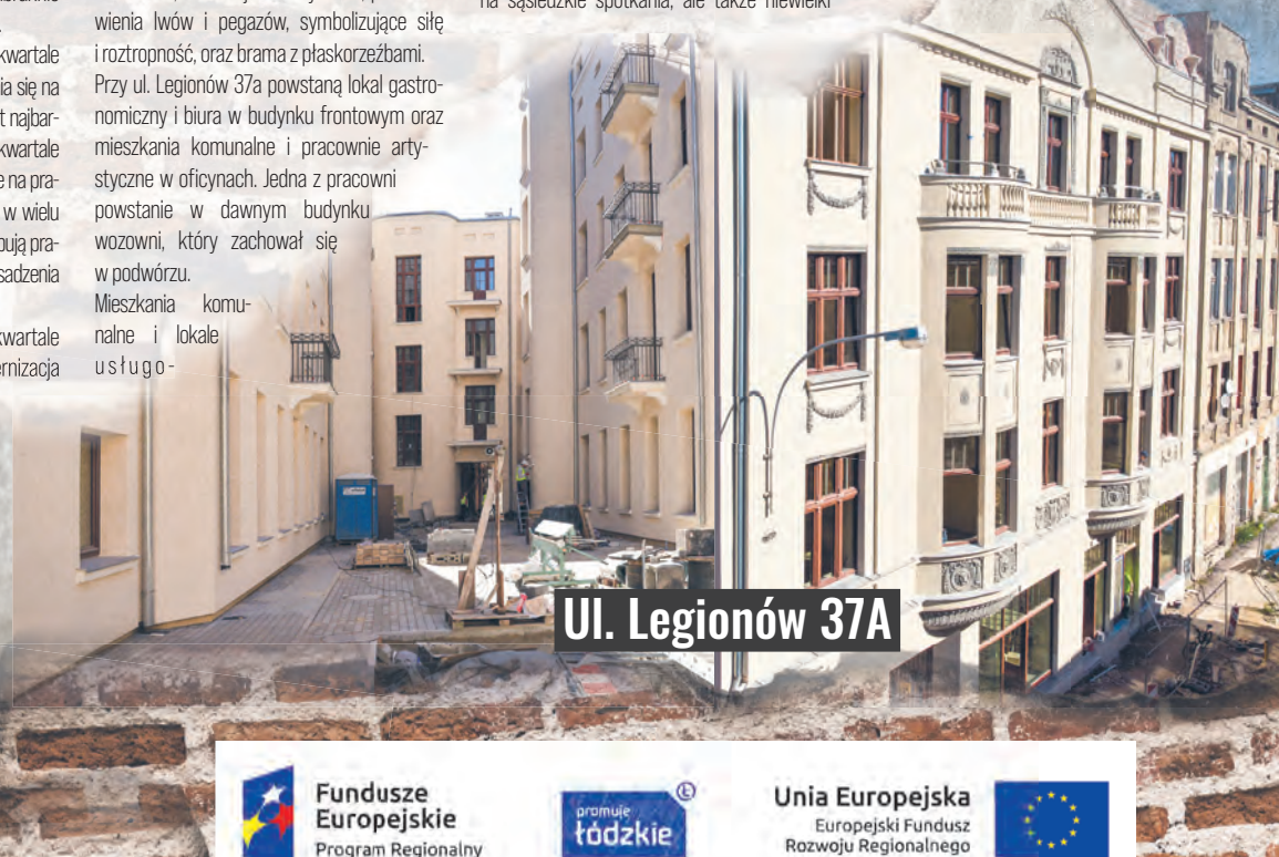
Ul. Legionów 37A