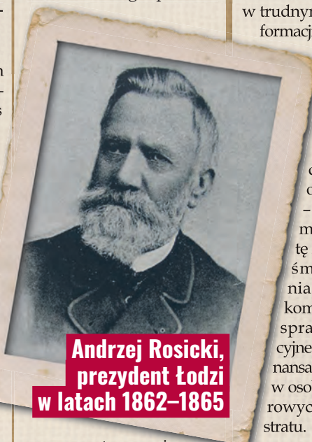
Andrzej Rosicki, prezydent Łodzi w latach 1862–1865

oddziału gwardii narodowej. Wywołało to konflikt, ale były bürgermeister nie znalazł już wsparcia u kolejnego burmistrza – Szymona Szczawińskiego, powoła-