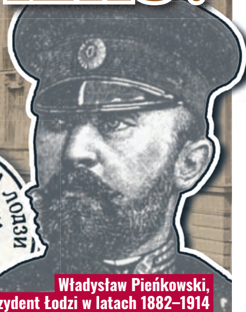
Władysław Pieńkowski, prezydent Łodzi w latach 1882–1914

Pieczenie łódzkiego magistratu: jeszcze w języku polskim z 1842 r., dwujęzyczna z 1867 r. i już jedynie rosyjska z 1876 r.