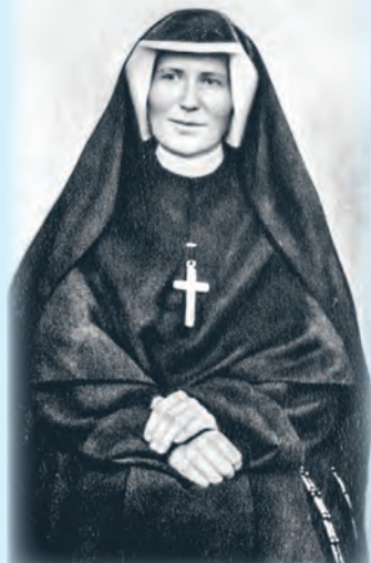
Siostra Faustyna Kowalska