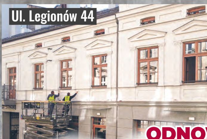
Ul. Legionów 44